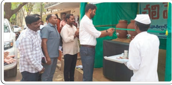
గా మణుగూరు తహసీల్దారు కార్యాలయాన్ని కలెక్టర్ పరిశీలించారు. ఈ