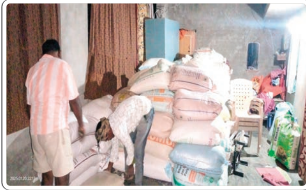
(మొదటి పేజీ తరువాయి...)

బియ్యంను పట్టుకునేందుకు దైర్యం చేయని అధికారులు.. ఇలా చెప్పుకుంటూ పోతే అతని రేషన్ బియ్యం దందాలకు అడ్డు అడుపులేకుండా పోతుంది. పట్టపగలు రాత్రిళ్లు అనే తేడాలుండవు. రేషన్ బియ్యం కోటా ప్రారంభమైన దగ్గర నుండి 10, 15 రోజుల వరకు ఈ దందా యదేచ్ఛగా కొనసాగిస్తుంటారు. ఇక్కడికి అధికారులు వచ్చి మాముళ్లు తీసుకుని వదిలేస్తారనేది బహిరంగ రహస్యం.. అందరు అధికారులు తెలుసు నన్ను ఎవరు పట్టుకోరు. పట్టుకున్నా వదిలేస్తారనే ధీమాతో ఆడిందే ఆట పాడిందే పాటగా మారింది. అక్రమ దందాలో ఆరితేరిన అతనిని పట్టుకోవాలంటే అధికారులు జంకుతారని తన అనుచరులు, స్నేహితుల వద్ద గోప్పలు చెప్పుకోవడం ఈ చక్రాల సింహూడు సైల్..