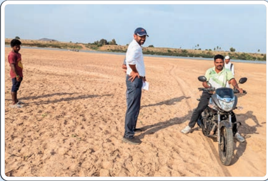
భద్రాద్రి కొత్తగూడెం జిల్లా ప్రతినిధి, మార్చి 4, ప్రజాజ్యోతి :

చర్ల ఇసుక రిచ్ లను ఆకస్మిక తనిఖీ చేసిన జిల్లా కలెక్టర్ జితేష్ వి. పాటిల్