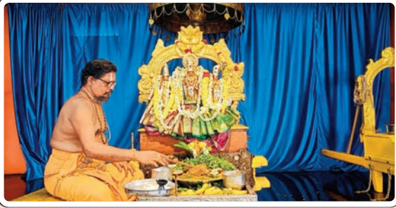
భద్రాచలం, మార్చి 4, ప్రజాజ్యోతి :

భద్రాచలం శ్రీ సీతారామచంద్రస్వామి దేవస్థానంలో మంగళవారం సీతారాములకు అర్చకులు నిత్యకల్యాణం నిర్వహించారు. తెల్లవారుజామున స్వామివారికి సుప్రభాతసేవ, ఆరాధన, ఆరగింపు, సేవాకాలం, నిత్యహోమాలూ, నిత్యబలిహారణం తదితర నిత్యపూజలు నిర్వహించారు. గాలి గోపురానికి అభిముఖంగా ఉన్న ఆంజనేయస్వామివారికి ఉదయం పంచామృతాభిషేకం చేసి తమలపాకులు, సింధూరంతో పూజలు చేశారు. అనంతరం స్వామివారి నిత్యకల్యాణ మూర్తులను బేదా మండపానికి తీసుకువచ్చి నిత్యకల్యాణం నిర్వహించారు. కల్యాణంలో పాల్గొన్న జంటలకు ప్రసాదాలు, శేషవస్త్రాలు అందజేశారు.