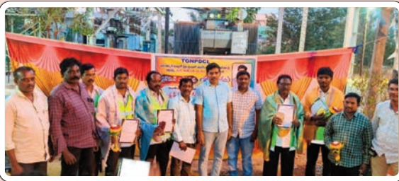
బూర్గంపహాడ్, మార్చి 04, ప్రజాజ్యోతి :