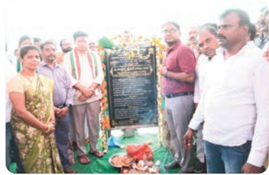
దని ఆయన ఈ సందర్భంగా వెల్లడించారు.