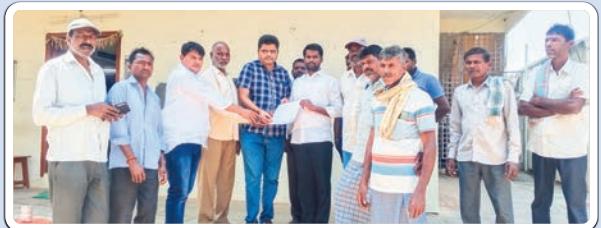
ముస్తాబాద్ మర్చి 1 (ప్రజాజ్యోతి)