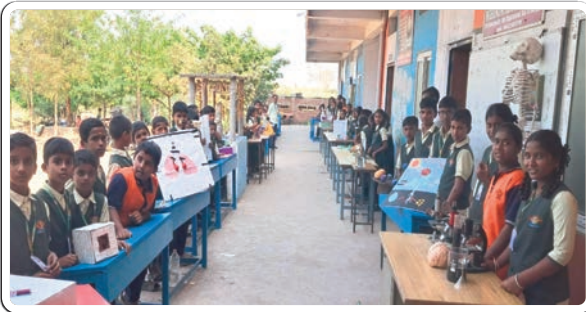
ఉన్న సృజనాత్మకతను వెలికి తీసేందుకు ఇటువంటి ప్రదర్శనలు ఎంత