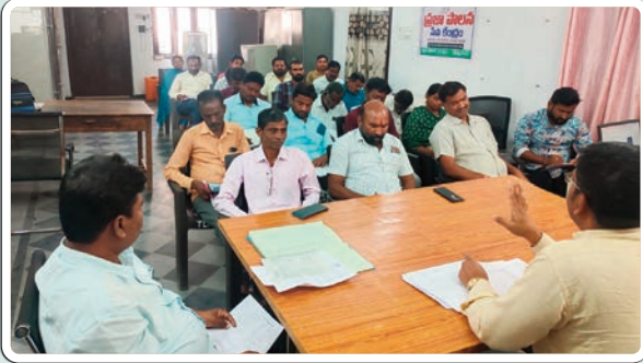
చొప్పదండి, మార్చి 1 (ప్రజాజ్యోతి):