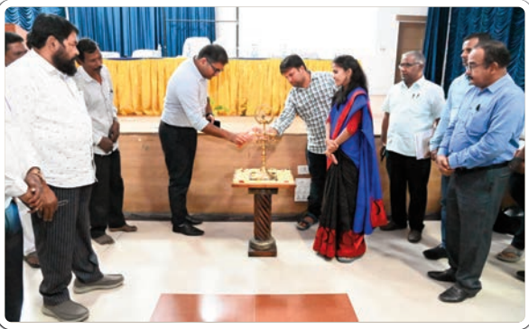
పెద్దపల్లి ప్రతినిధి, (ప్రజాజ్యోతి), మార్చి-01: