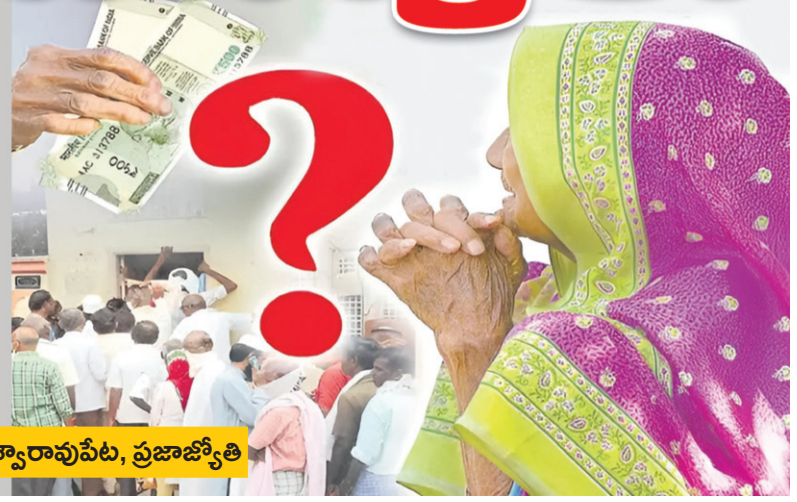
♦ అస్వారావుపేట, ప్రజాజ్యోతి

పనిచేసుకునేందుకు వయసు సహకరించే పరిస్థితి లేదు.. జీవనం సాగేందుకు ఆధారమూ లేదు.. ఆదుకునేవారు లేరు వయసుపైబడిన అన్ని అర్హతలూ ఉన్నా ప్రభుత్వం అవ్వ, తాతలకు రూ. 4వేలు, దివ్యాంగులకు రూ. 6వేలు పెంచి అందిస్తానన్న పింఛన్ అందించి ఆదుకోవడంలో ఎందుకో దాటవేసే ధోరణి అవలంబిస్తోంది. వృద్ధులు, వితంతువులు, ఒంటరి మహిళలు ప్రభుత్వ కార్యాలయాల చుట్టూ తిరుగుతున్నా, అధికారులకు, ప్రభుత్వానికి దయ కలగడంలేదు.