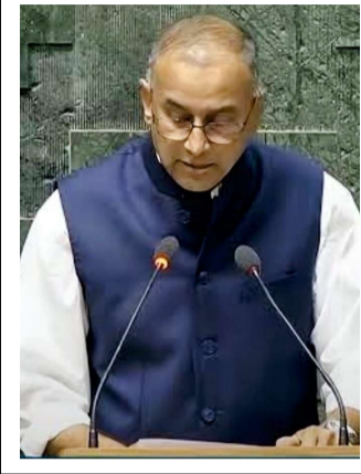
అందించడం, మద్దతు ధర కల్పించడం, నిల్వ మౌలిక సదుపాయాలను అభివృద్ధి చేయడం, తక్కువ వడ్డీకి రుణాలు అందించడం.. వంటి సమస్యలను పరిష్కరించాలని కోరుతున్నాం.

ఖమ్మం ప్రతినిధి, (ప్రజా జ్యోతి) : మిర్చి రైతులను కేంద్రం ఆదుకోవాలి. సబ్సిడీ రుణాలు అందించి, నకిలీ విత్తనాల విక్రయాలను నియంత్రించాలి. లోక్ సభలో 377 నిబంధన కింద కేంద్ర వ్యవసాయ, రైతు సంక్షేమ శాఖల మంత్రిని కోరిన ఖమ్మం ఎంపీ రామసహాయం రఘురాం రెడ్డి తెలంగాణ రాష్ట్రంలో ఖమ్మం, వరంగల్, మహబూబాబాద్ జిల్లాల్లో మిరప పంట అత్యధికంగా సాగవుతోందని.. అయితే రైతులు అనేక రకాలుగా ఇబ్బందులు ఎదుర్కొంటున్నారని, కేంద్ర ప్రభుత్వం ఈ సమస్యలను పరిష్కరించాలని ఖమ్మం ఎంపీ రామసహాయం రఘురాం రెడ్డి లోక్ సభలో కోరారు. ఈ మేరకు 377 నిబంధన కింద మిర్చి రైతుల పక్షాన పలు అంశాలను ప్రస్తావించారు. ఆ వివరాలు ఇలావి దేశంలో మిర్చి ఉత్పత్తిలో రాష్ట్రం అగ్రభాగంలో ఉంది. గతేడాది 12.43 లక్షల హెక్టార్లలో మిర్చి సాగు చేయగా 48.29 లక్షల టన్నుల దిగుబడి వచ్చింది. ఖమ్మం, వరంగల్, మహబూబాబాద్ జిల్లాల్లో అత్యధికంగా సాగవుతోంది. తెల్లదోమ, విల్డ్ మరియు ఆకు ముడత వంటి తెగుళ్లతో రైతులు ఇబ్బంది పడుతున్నారు. విత్తనాలు,