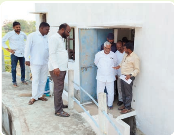
(మొదటి పేజీ తరువాయి...)