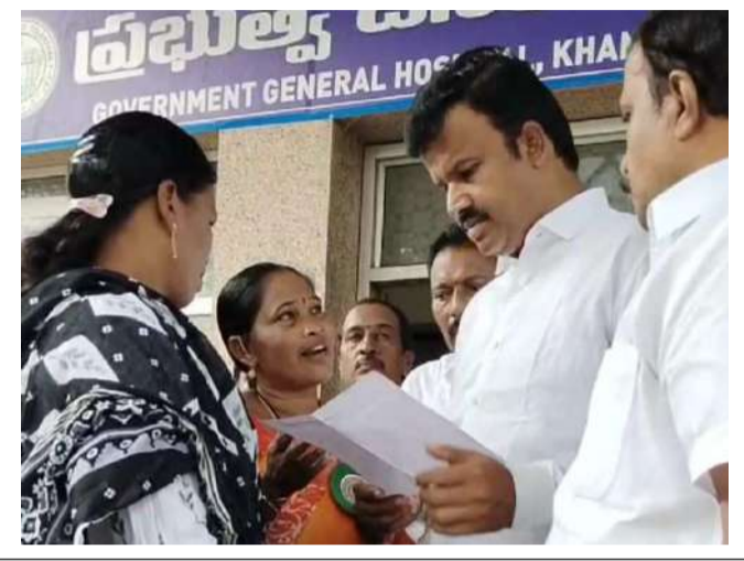
ఖమ్మం ప్రతినిధి, (ప్రజా జ్యోతి) : జిల్లా కేంద్రమైన ఖమ్మం నగరానికి సమీపంలోని రఘునాథ పాలెం మండలం పరిధిలోని పువ్వాడ ఉదయ నగర్ కు సంబంధించిన పలు సమస్యలపై ఆదివారం కాంగ్రెస్ నాయకుడు