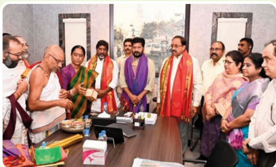
(మొదటి పేజీ తరువాయి...)

ఆదివారం ఆహ్వానపత్రకలు అందజేశారు. అనంతరం వేదపండితులు వారికి ప్రత్యేక పూజలు నిర్వహించి వేదాశీర్వాచనాలు అందజేశారు. అనంతరం శ్రీరామనవమి బ్రహ్మోత్సవాలకు సంబంధించిన వాల్ పోస్టర్ ను సీఎంచే ఆవిష్కరించేశారు. ఈ కార్యక్రమంలో పలువురు అధికారులు పాల్గొన్నారు.