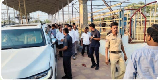
(మొదటి పేజీ తరువాయి...)

కల్యాణమండపంలోని భక్తులకు, కల్యాణమండపం బయట ఉండే భక్తులకు పాలిహోజు ఏర్పాట్లు చేస్తున్నామని, కరకట్ట పక్కన తక్కువ ఖర్చుతో భక్తులు బస చేయడానికి క్యాంపు షేడ్ హాజ్ లు ఏర్పాటు చేశామని అన్నారు. ఎండాకాలం వస్తున్నందున భక్తులు వారు బస చేసే ప్రాంతం కల్యాణమండపానికి రావడానికి రవాణా సౌకర్యం కల్పిస్తున్నామని కల్యాణం తిలకించడానికి వచ్చే భక్తులకు అన్ని రకాల సౌకర్యాలు కల్పిస్తామని కలెక్టర్ అన్నారు. అనంతరం భక్తులకోసం చేపడుతున్న టాలెంట్లు, వాప్రూములు, వాహనాల పార్కింగ్ ప్రదేశాలను పరిశీలించారు.