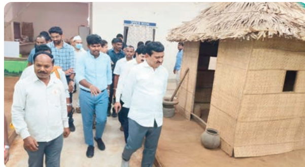
(మొదటి పేజీ తరువాయి...)

ఉగాదిలోగా ప్రతి పేదవానికి ఇందిరమ్మ ఇళ్లు ఇచ్చేందుకు ప్రణాళికలు సిద్ధం చేస్తున్నామన్నారు. 20లక్షల ఇండ్లు అందించేలా లక్షల పెట్టుకున్నామని దశలవారీగా ఇండ్లు నిర్మించి ఇస్తామన్నారు.