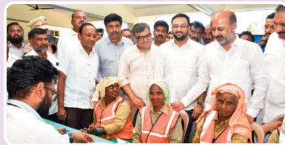
(మొదటి పేజీ తరువాయి...)