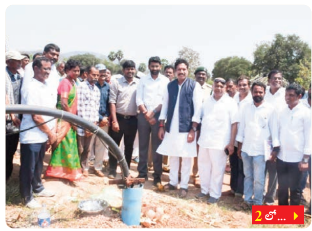
2 లో... >