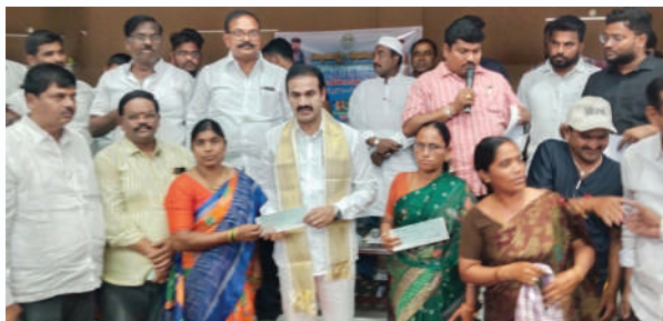
మరిపెడ, మార్చి 16 (ప్రజాజ్యోతి)

- ప్రభుత్వ వివేకాధికార ఎమ్మెల్యే డాక్టర్ రాంబండ్రు నాయర్