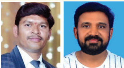
గణపూర్ణం మార్చి 16 (ప్రజాజ్యోతి):