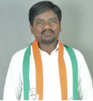
చేస్తున్నారు. ఇదే బిఆర్ఎస్ గతంలో శాసనమండలి చైర్మన్ మీద కాగితాలు పడేసారని ఇద్దరు సభ్యులను తొలగించారు, బర్తరఫ్ చేశారు. ఇవన్నీ ప్రజలు గమనిస్తూనే ఉన్నారు. ఇటువంటి నిరసనలు చేయడం మంచిది కాదన్నారు.