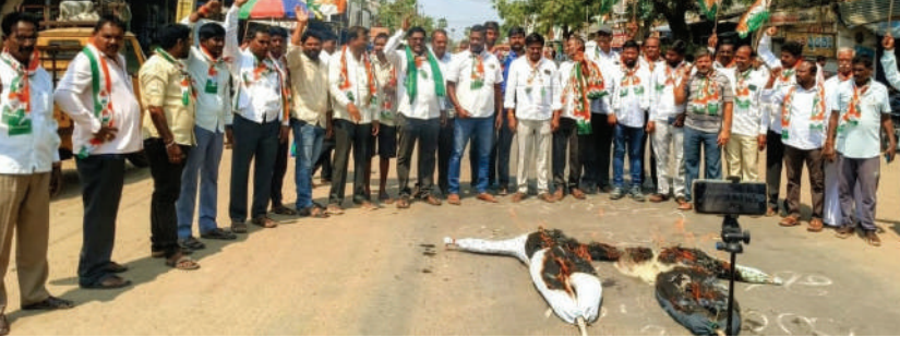
గణపూర్ణం మార్చి 16 (ప్రజాజ్యోతి):