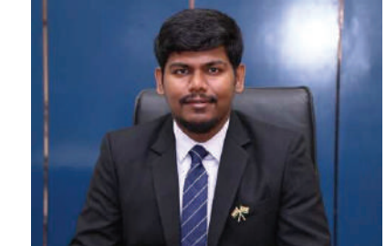
భద్రాద్రి కొత్తగూడెం, ఖమ్మం జిల్లాలోని ఎంపీడీవోలు రాజీవ్ యువ వికాసం పథకం గురించి గిరిజన నిరుద్యోగ యువకులకు తెలిసేలా మీ మండల పరిధిలో ముప్పురంగా ప్రచారం జరిగేలా ప్రత్యేక శ్రద్ధ తీసుకోవాలని ఆయన కోరారు.