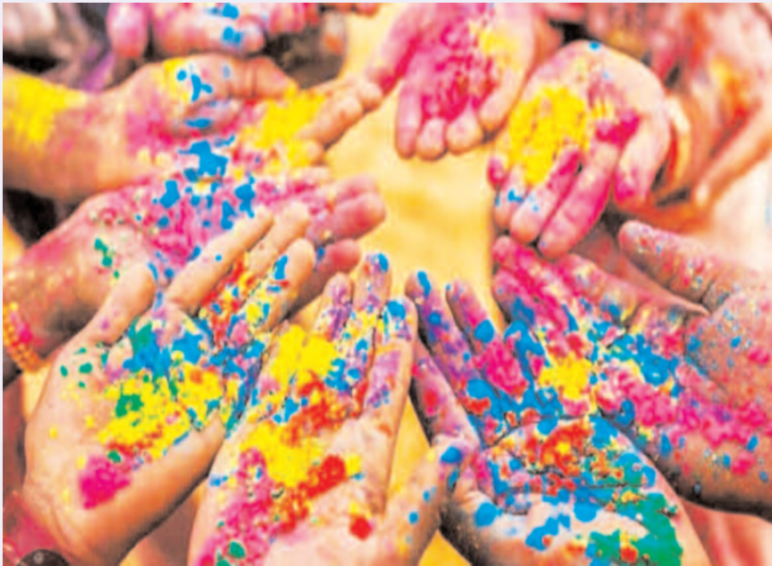
ప్రత్యేకమైన పండుగను అదే ప్రత్యేకమైన రోజు

శాస్త్రీయ కారణాల గురించి చెప్పుకుంటే వసంత కాలంలో వాతావరణం చలి నుంచి వేడికి మారుతుంది. దీనివల్ల చైరల్ జ్వరం, జలుబు లాంటి వ్యాధులు ప్రబలుతాయి. కాబట్టి కొన్ని ఔషధ మొక్కల నుంచి తయారు చేసిన సహజమైన రంగులు కలిపిన, నీటిని చల్లుకోవడం వల్ల ఈ వ్యాధుల వ్యాప్తి తగ్గుతుందనేది