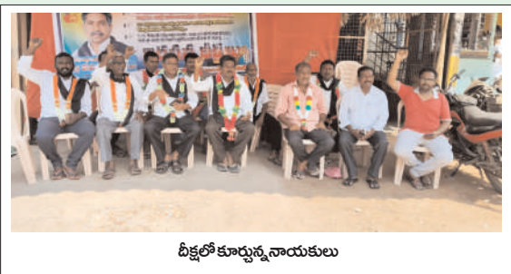
దీక్షలో కూర్చున్న నాయకులు