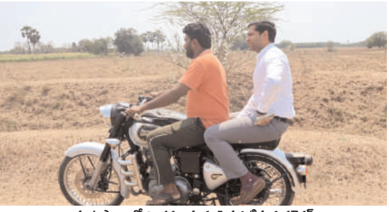
పంటపొల్లలో ద్వైచక్రవాహనంపై పర్యవేక్షణ కలెక్టర్