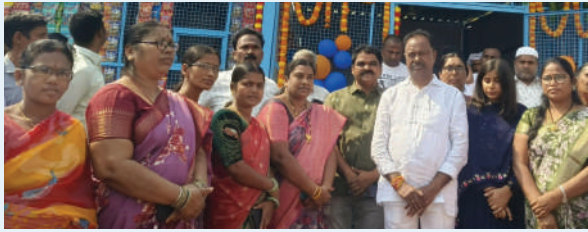
భూపాలపల్లి టౌన్, ప్రజాజ్యోతి, మార్చి 11.

భూపాలపల్లి జిల్లా కేంద్రంలోని ప్రభుత్వ ప్రధాన ఆసుపత్రిలో భూపాలపల్లి పురపాలక సంఘం, పట్టణ పేదరిక నిర్మూలన సంస్థ (మెప్పా) ఆధ్వర్యంలో ఏర్పాటు చేసిన క్యాంటీన్ ను ఎమ్మెల్యే గండ్ర నత్తనారాయణ రావు ముఖ్య అతిథిగా హాజరై ప్రారంభించారు. అసంతరం మీడియాతో మాట్లాడుతూ.. ఆసుపత్రికి వచ్చే రోగులు వారి సహాయకుల సౌకర్యార్థం నాణ్యమైన భోజనం అందించేందుకు సీఎం రేవంత్ రెడ్డి ప్రజా ప్రభుత్వం ఈ తరహా క్యాంటీన్ లను అందుబాటులోకి తెచ్చినట్లు తెలిపారు. ప్రజా ప్రభుత్వం మహిళల సంక్షేమానికి కట్టుబడి ఉందని, అందులో భాగంగా మహిళలకు ఎన్నో వినూత్న కార్యక్రమాలను చేపడుతున్నట్లు ఎమ్మెల్యే తెలిపారు. అంతకుముందు ఎమ్మెల్యే క్యాంటీన్ లో అల్పాహారం చేశారు. ఈ కార్యక్రమంలో అడిషనల్ కలెక్టర్ విజయలక్ష్మి, మెప్పా డి.ఎం.సీ వేమలవారి రాజేశ్వరి, ఎ.డి.ఎం.సి శ్యామ్, హాస్పిటల్ సూపరిండెంట్ సవీనీ కుమార్ మరియు వివిధ శాఖల సిబ్బంది పాల్గొన్నారు.