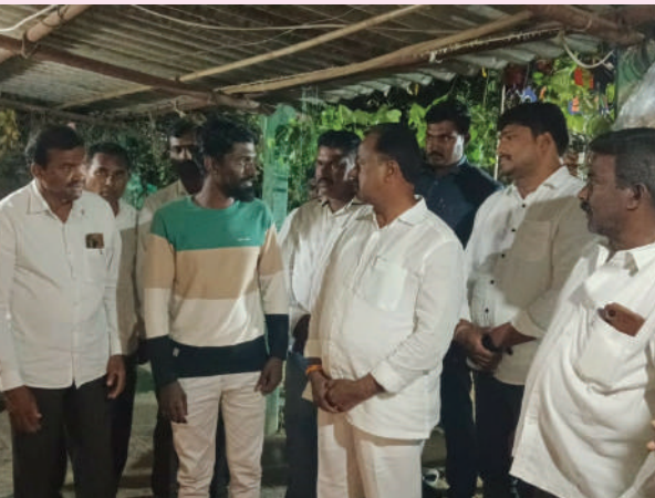
గణపురం ప్రజాజ్యోతి మార్చి 11