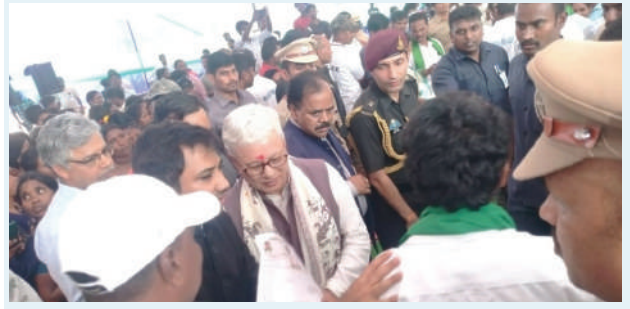
వెంకటాపురం, మార్చి 11 (ప్రజా జ్యోతి):