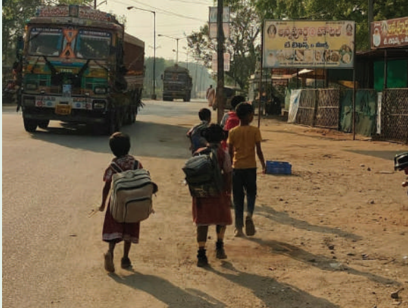
భూపాలపల్లి బ్యారో మార్చి 11 (ప్రజాజ్యోతి)

జయశంకర్ భూపాలపల్లి జిల్లా మహాదేవపూర్ మండలంలో సుమారు 11 ఇసుక క్వారీలు నడుస్తుండగా సమయ పాలన లేకుండా విచ్చలవిడిగా ఇసుక లారీలు అధిక స్పీడుతో వెళుతూ ప్రజలను భయభ్రాంతులకు గురి చేస్తున్న సందర్భాలు ఉన్నాయి. అదే కాకుండా అధిక స్పీడ్ తో వెళుతూ ప్రమాదాలు జరిగిన రోజులు కూడా ఉన్నాయని ఈ ప్రాంత ప్రజలు ఆవేదన వ్యక్తం చేస్తున్నారు. ఇసుక క్వారీలు లారీలు ఊర్లలో ప్రవేశించగానే స్పీడ్ తగ్గించి వెళ్లాలని అదే కాకుండా స్కూల్ సమయాల్లో నియంత్రించాలని ఉదయం సాయంత్రం వేళలో విద్యార్థులకు ఇబ్బందులు లేకుండా చూడాల్సిన బాధ్యత అధికారులపై ఎంతైనా ఉందని ఈ ప్రాంత ప్రజలు వాపోయారు.