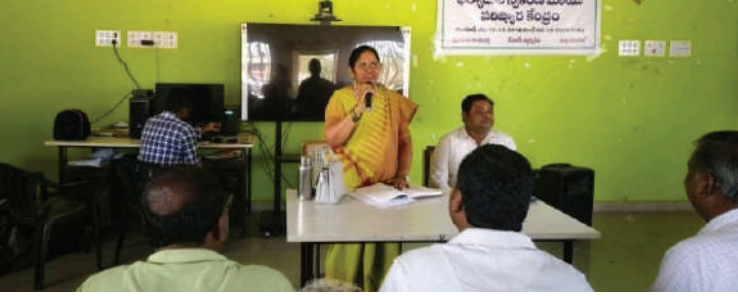
రాయపర్తి మార్చి 11, ప్రజా జ్యోతి.