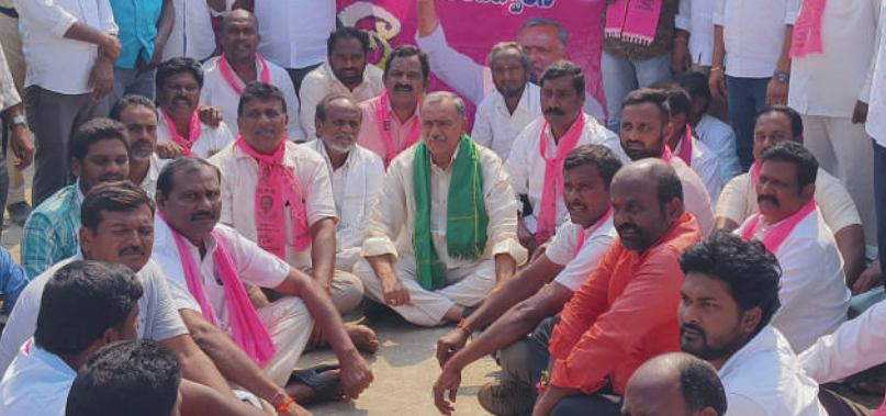
శాయంపేట మార్చి 11