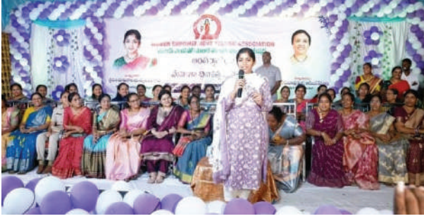
రాయపర్తి మార్చి 11 ప్రజా జ్యోతి.

పాలకుర్తి నియోజకవర్గంలో అంతరాష్ట్రీయ మహిళా దినోత్సవ వేడుకలు ఘనంగా నిర్వహించిన వేట. తొంద్రూరు మండల కేంద్రంలోని రెడ్డి గార్డెన్ లో మంగళవారం అంతర్జాతీయ మహిళా దినోత్సవ వేడుకలు వేట