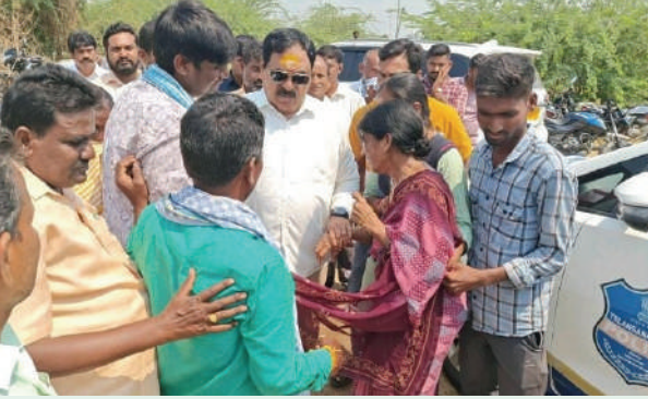
రాయపర్తి, మార్చి 11, (ప్రజాజ్యోతి):