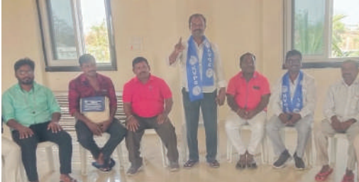
మరిపెడ, మార్చి 11 (ప్రజాజ్యోతి)