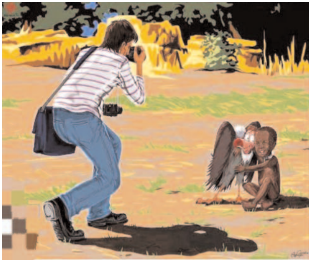
ఈ ఫోటో కెవిన అనే ఫోటో గ్రాఫర్ సూడాన్ లో..!

రామారెడ్డి (ప్రజా జ్యోతి) మార్చి 10 ప్రపంచ ఫోటోగ్రఫీ మేధావి అప్పట్లో కెవిన ఒక్కసారిగా ఆత్మహత్య చేసుకున్నాడు అంటే ప్రపంచమే నమ్మలేదు..? కారణం ఏమిటి ఎందుకని ప్రశ్నగా మిగిలిపోయిన ఆ మేధావి తీసిన ఫోటో తనకే ప్రశ్నార్థకంగా మారింది..? అతను తీసిన ఫోటోని చూసిన అభిమాని అడిగిన ప్రశ్నకు తన ప్రాణం తీసుకున్నంత జవాబు చెప్పలేని పరిస్థితిలో ఉండిపోయాడట..? నిజమే అంటున్నారా అప్పటి మేధావులు..! ఫోటో నీ పరిశీలించి చూడగా..! ఆ పాప అనుకుంటుంది, రాబందు వచ్చి ఆహారాన్ని ఎత్తుకుపోతుందని దాచుకొంటోంది. కానీ, పాపకు తెలియని విషయం ఏంటంటే, రాబందు చూసేది ఆహారం కోసం కాదు..? ఆ పాప కోసమే..! ఆ యొక్క దుర్భర స్థితిలో ఆ యొక్క దేశ ఆర్థిక పరిస్థితి బాగా లేక ఆర్థిక మాంద్యం పడిపోయి ప్రజలకు సరిగా తిండి లేక చావడానికి సిద్ధంగా ఉన్న బక్క చిక్కిన ప్రాణాలను ప్రపంచానికి తెలియజేయాలని ప్రపంచ మేధావి ఫోటోగ్రాఫర్ కెవిన అనే వ్యక్తి ఆ దేశానికి వెళ్లి ఆ యొక్క ఫోటో చిత్రాన్ని చిత్రీకరించాడు. ఇక విషయానికి వస్తే తిండి సరిపోక ఆకలితో అలమటించి ఆ పాప చనిపోతే తిందామని..? దేగ చూస్తున్నట్లు ఉంది.