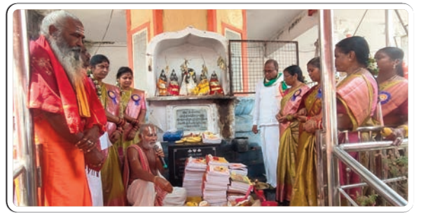
జమ్మికుంట, మార్చి 9 (ప్రజాజ్యోతి):