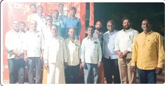
చిగురుమామిడి మార్చి 09 (ప్రజా జ్యోతి)