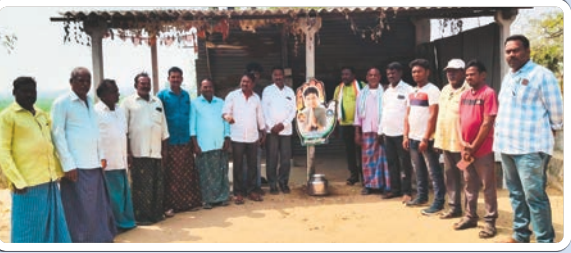
ముత్తారం మార్చి, 09 (ప్రజాజ్యోతి)

సి ఆర్ ఆర్ గ్రాంట్ ద్వారా 97.50 లక్షలు మంజూరు.. కృతజ్ఞతలు తెలిపిన దళిత నాయకులు