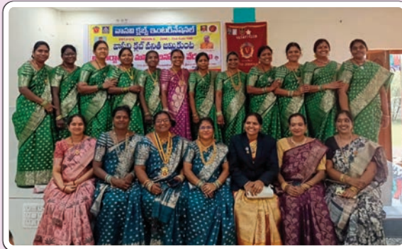
జమ్మికుంట, మార్చి 9 (ప్రజాజ్యోతి):

ప్రతి మగవాడి విజయం వెనుక స్త్రీ పాత్ర కీలకం వాసవి వనిత క్లబ్ అధ్యక్షురాలు అభిలాండం