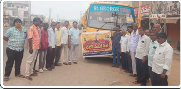
చొప్పదండి, మార్చి 9 (ప్రజా జ్యోతి):