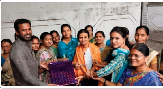
పెద్దపల్లి ప్రతినిధి, (ప్రజా జ్యోతి), మార్చి 09:

ఆధునికయుగంలో మహిళలు అన్నీ రంగాల్లో రాణించడం గొప్ప విషయమని పలువురు వక్తలు అన్నారు. అంతర్జాతీయ మహిళా దినోత్సవం పుర