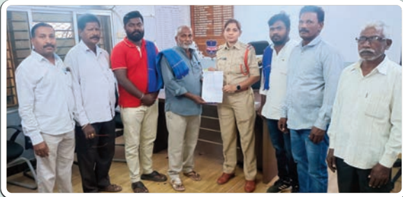
చొప్పదండి, మార్చి 9 (ప్రజా జ్యోతి):