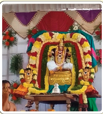
జగిత్యాల రూరల్, మార్చి 9, ప్రజా జ్యోతి