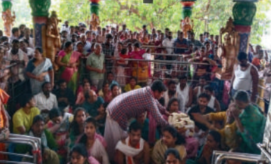
మంగపేట, మార్చి, 1 (ప్రజాజ్యోతి):

మండలంలోని మల్లూరు శ్రీ హేమాచల లక్ష్మీ నృసి