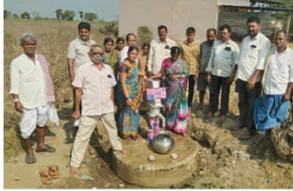
కల్పించిన ఫౌండేషన్ చైర్మన్, బి.ఆర్.ఎస్ పార్టీ జిల్లా

ఏడ పోయినాడు రాయపర్తి, మార్చి 1, ప్రజా జ్యోతి. రాష్ట్ర మాజీ మంత్రివర్యులు ఎర్రబెల్లి దయాకర్ రావు ఆదేశాల మేరకు శనివారం రాయపర్తి మండలం బాలు నాయక్ తండా గ్రామంలో ఇటీవల తండా పర్వతం ను వచ్చిన తనకు మంచి నీళ్లకు ఇబ్బంది అవుతుంది అని స్థానిక మహిళలు, ప్రజల వినతి మేరకు తక్షణమే స్పందించి తన ఫౌండేషన్ ఆధ్వ ర్యంలో 25,000 రూపాయలు ఖర్చు పెట్టి బోరింగ్ వేయించి స్థానిక ప్రజలకు మంచి నీళ్ల సౌకర్యం