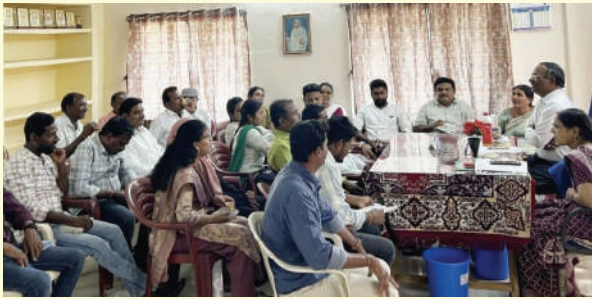
పరకాల, మార్చి, 1 (ప్రజాజ్యోతి):