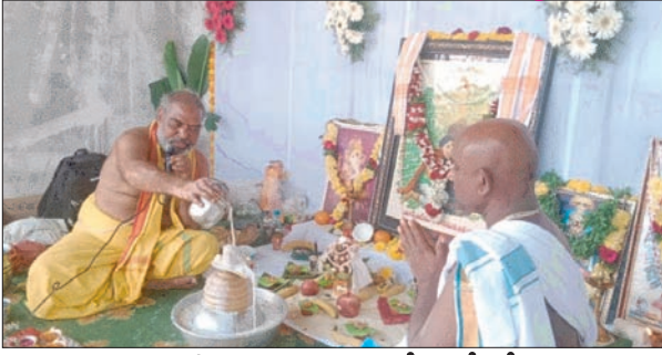
మహా అన్నప్రసాద వితరణ పురవీధుల్లో శోభయాత్ర అత్యుకారు, ఫిబ్రవరి 01 (ప్రజాజ్యోతి):