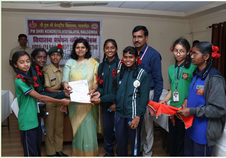
కలెక్టర్ ఇలా త్రిపాఠి