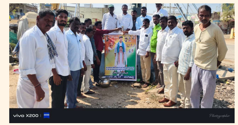
అంబేద్కర్ ఆశయాలు అనుగుణంగా రేవంత్ రెడ్డి ప్రభుత్వం పనిచేస్తుంది ఏబిసిడి వర్గీకరణ అసెంబ్లీ లో ప్రతిపాదించిన ఘనత ముఖ్యమంత్రి రేవంత్ రెడ్డి