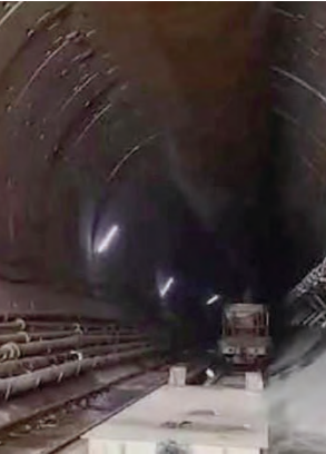
ప్రమాదానికి దారితీసిన కార్మికులు ఆరోపిస్తున్నారు. -ఎస్ఎల్ బిఎస్ ఫుటనపై సీఎం రేవంత్ రెడ్డి దిగ్భ్రాంతి..

మొదటిపేజీ తరువాయి.. గౌరవాలపాలయ్యారు. ప్రభుత్వం టన్నెల్ నిర్మాణ పనులను వేగంగా పూర్తి చేయాలనే లక్ష్యంతో ఇంజనీర్లపై తీవ్ర ఒత్తిడి తీసుకొచ్చినట్లు సమాచారం. సీజన్ ప్రారంభమైన నేపథ్యంలో ఏడాదిలోపు