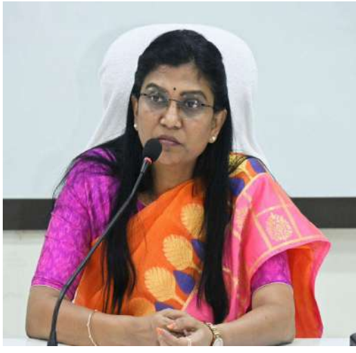
ఇవ్వాలని రాజాసగరం మండలం యుర్రంపాలెం గ్రామ

రాజమహేంద్రవరం, ఫిబ్రవరి 8 (ప్రజా జ్యోతి ప్రతినధి) క్షేత్ర స్థాయిలో రీ సర్వే ప్రక్రియను నిర్వహించే మార్గదర్శకాలను అనుసరించి నిర్ణీత సమయంలో పూర్తి చెయ్యాలి అంటుందని, అందులో భాగంగా నిర్ణీత వహించిన అధికారులకు సిబ్బందికి డో కాజ్ నోటీసులు జారీ చేసినట్లు జిల్లా కలెక్టర్ పి. ప్రకాశి శనివారం ఒక ప్రకటనలో తెలిపారు. విబంధనలు అనుసరించి సచివాలయం సర్వీసెస్ స్టేటస్ రిపోర్టును దృవీకరించిన తర్వాత, నిర్ణీత గ్రామ సర్వేయర్లు తమ విధులను సమర్థవంతంగా నిర్వహించడం లేదని జిల్లా యంత్రాంగం దృష్టికి వచ్చిందన్నారు. అధికారిక విధులను నిర్వహించడంలో నిర్ణీత మరయు ఉన్నతాధికారుల ఆదేశాలను పాటించడంలో వైఫల్యం వల్ల జిల్లా పరిపాలనకు ఇబ్బందికరమైన పరిస్థితికి దారితీసిందన్నారు. వీటిపై వివరణ