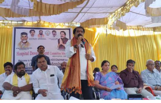
గుంతకల్ నియోజకవర్గం కూటమి నేతలు, నాయకులు, కార్యక్రమ అధికార సిబ్బంది తదితరులు పాల్గొన్నారు...

ముఖ్యమంత్రి శ్రీ. నారా చంద్రబాబు నాయుడు కి ప్రతిపాదన పంపుతామని వందవేల కాకుండా కచ్చితంగా సాధించిన తీరుతామని తెలిపారు ఇప్పటికే రోజుకు ప్రభుత్వ ఆసుపత్రి లో 600నుండి 700వరకు ఓ పీ లు నమోదు అవుతున్నాయని ప్రజలకు సేవ చేస్తున్న ఆసుపత్రి సిబ్బంది కి ధన్యవాదములు అని అన్నారు,అంతే కాకుండా రాష్ట్రములో ఉన్న 175నియోజక వర్గాలలో మొట్టమొదటిసారిగా మన గుంతకల్ నియోజకవర్గం కి ఎక్కువగా సీఎం రిలీఫ్ ఫండ్ పెద్దాయన నారా చంద్రబాబు నాయుడు సహకారం తో అందజేశామని తెలిపారు,ఈ కార్యక్రమం లో