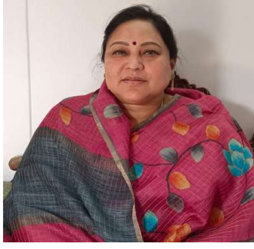
లెక్కలు చెప్పి తప్పించుకుంటున్నారు. వివరకు.. నీతి ఆయోగ్ రిపోర్టు గురించి వివరణ ఇస్తూ పథకాల అమలు తనవల్ల కాదని చేతులెత్తేశారు. అప్పుల మీద అప్పులు చేయడమే సంపద సృష్టిలా బావిస్తూ చంద్రబాబు కూటమి ప్రభుత్వం పాలన కొనసాగిస్తుందిన్నారు. ఇక 2014-19 మధ్య ఉన్న చంద్రబాబు బడేశ్ పాలనను 2019-24 మధ్య జగన్ బడేశ్