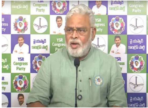
ప్రసాదాలలో కల్పి జరగలేదు చంద్రబాబు నాయుడు ఆరోపణలపై విచారణ జరుగుతోంది 2014 నుంచి 19 వరకు చంద్రబాబు నాయుడు ప్రభుత్వంలో 15 సార్లు నెయ్యి నిబంధనలకు విరుద్ధంగా ఉన్నాయని వెనక్కి పంపారు వైఎస్ జగన్ ప్రభుత్వంలో నిబంధనల ప్రకారం 18సార్లు నెయ్యి వెనుక్కు పంపారు చంద్రబాబు

-మొదటిపేజీ తరువాయి ప్రపంచవ్యాప్త గుర్తింపు ఉంది.తిరుమల లడ్కూల తయారీకి నెయ్యి సరఫరాకు ఒక వద్దతి ఉంది.ఏఆర్ డెయిర్ చంద్రబాబు అధికారంలోకి వచ్చాకే నెయ్యి సరఫరా ప్రారంభించారు. టెన్షన్లో ఫెయిలైన ట్యాంకర్లను వెనక్కి పంపుతారు.వైఎస్ జగన్ హయాంలోనూ ట్యాంకర్లను వెనక్కి పంపారు.దైవాన్ని అడ్డుపెట్టుకుని చంద్రబాబు రాజకీయంగా లబ్ధి పొందాలనుకున్నారని అంటే రాంబాబు అన్నారు. తిరుమల లడ్కూ వ్యవహారం నుంచి బయటపడటానికి బాబు అంటిస్తున్నారు. అంటి రాంబాబు ఇంకా ఏమన్నారుంటే.. చంద్రబాబు నాయుడు అత్యంత దుర్మార్గుడు నీచుడు పవిత్రమైన శ్రీ వెంకటేశ్వర స్వామి వారి ప్రసాదాన్ని రాజకీయం లబ్ధి కోసం వాడుకున్నాడు నిబంధనల ప్రకారం వెనుక్కు పంపించిన నెయ్యి పైన అరెస్టులు జరుగుతున్నాయి చంద్రబాబు నాయుడు చెప్పినట్టు ఎక్కడా స్వామివారి