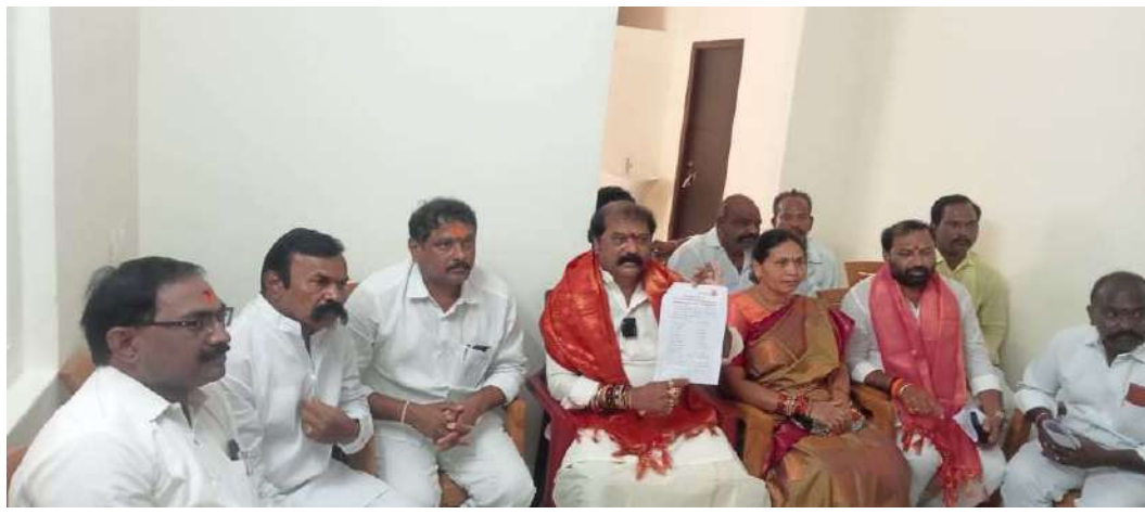
నియోజకవర్గం లో ప్రతి పక్షంలో సినీ రోడ్డు, కాలవలు వేసాం ఇది కేంద్రంలో ప్రధాన మంత్రి మోడీ అలాగే రాష్ట్రంలో పెద్దాయన సీఎం చంద్రబాబు నాయుడు డిప్యూటీ సీఎం పవన్ కళ్యాణ్ కి గుంతకల్ నియోజకవర్గం తరఫున ధన్యవాదాలు తెలుపుతున్న ఈ కార్యక్రమంలో గుంతకల్ ఇన్సార్

గుంతకల్ టౌన్ ప్రజా జ్యోతి: గుంతకల్ పట్టణంలో ఎమ్మెల్యే కాంస్ కార్యాలయంలో విలేజ్ కరల సమావేశంలో ఎమ్మెల్యే గుమ్మనూరు జయరాం మాట్లాడుతూ గడిచిన నెలలో ఆరోగ్యశ్రీ, ఫీజు రియంబర్స్ మెంట్, లాంటి జగన్ ప్రభుత్వం బకాయిలు 22,000 కోట్లను అప్పు చేస్తే చంద్రబాబు ప్రభుత్వం చెల్లించి అప్పులు కూడా పుట్టని స్థితి ఏర్పడింది ఏడాదికి 71 వేల కోట్లు అనలు వడ్డీ చెల్లించి ఇది చంద్రబాబు నాయుడు కు గుడి బ%శీ%దగ గుండ్ కానీ సూపర్ సిక్స్ లో మూడు ఇప్పటికే మంజూరు చేశారు సూపర్ సిక్స్ లో మూడు ప్రకటించారు ఒకటి మెగా డీఎస్సీ, రెండు మహిళలకు గ్యాస్, మూడు వికలాంగులకు పింఛన్లు 6000 నుంచి 15000 దాకా పెంచడం జరిగింది మన రాష్ట్రంలోనే గుంతకల్లు సీఎం రిలిఫ్ ఫండ్ కింద 174 ఎంతమందికీ పంపించాను అంతమందికీ డబ్బులు వచ్చాయి దాదాపుగా కోటి పైనే చెక్కులు అందజేసిన్న ఘనత తెలుగుదేశం పార్టీ అని చెప్పవచ్చు పార్టీ సభ్యత్వాల కూడా కోట్ల సభ్యత్వాల ఏదంటే అది తెలుగుదేశం పార్టీని అని చెప్పవచ్చు నారా లోకేశ్ 20 లక్షల ఉద్యోగాలు ఇస్తామని చెప్పారు గుంతకల్