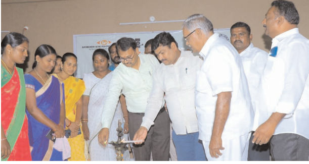
మరిపెడ, ఫిబ్రవరి 09