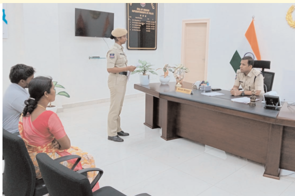
భూపాలపల్లి టౌన్, ఫిబ్రవరి 09 (ప్రజాజ్యోతి):

ప్రజల ఫిర్యాదులను పెండింగ్ లో పెట్టాల్దని జయశంకర్ భూపాలపల్లి జిల్లా ఎస్పీ శ్రీ కిరణ్ ఖర్ అన్నారు. సోమవారం ప్రజాదివాన్ కార్యక్రమంలో భాగంగా జిల్లా పోలీసు కార్యాలయంలో వివిధ సమస్యలపై వచ్చిన బాధితుల నుంచి ఎస్పీ గారు పిర్యాదులు స్వీకరించి, వారితో ముఖాముఖి మాట్లాడి ఫిర్యాదు దారుల సమస్యలను తెలుసుకున్నారు. అనంతరం సంబంధిత పోలీసు అధికారులకు చట్టపరంగా చర్యలు తీసుకొని బాధితులకు న్యాయం చేయాలని అదేశించారు. ఆయా ఫిర్యాదులపై తీసుకున్న చర్యలను నిర్దిత సమయంలో జిల్లా పోలీస్ కార్యాలయానికి నివేదిక రూపంలో పంపించాలని ఎస్పీ గారు అధికారులు అదేశించారు.