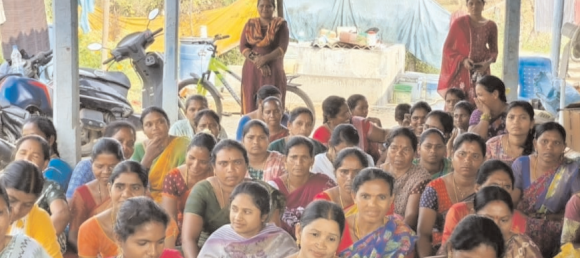
ఉల్లంపించేలా ప్రభుత్వ విధానం ఉంటే ఉపేక్షించ బోమని ప్రభుత్వాన్ని హెచ్చరించారు. రెండు మండలాల ఇసుక సొసైటీల సభ్యులు పాల్గొన్నారు.

ప్రభుత్వాన్ని కోరారు. ఎన్నో ఏళ్లుగా దోపిడికి గురి అవుతున్నామని అన్నారు. కారు చౌకగా ఇసుకను తరలిస్తూ సొసైటీలకు చిల్లర వేస్తున్నారని మండిపడ్డారు. 2013లో నిర్ణయించిన 220 రూపాయలతో ఆదివాసీలకు అన్యాయం జరుగుతోందని అన్నారు. పెరిగిన ధరలకు అనుగుణంగా క్యూబిక్ మీటర్ కి వెయ్యి రూపాయలు నిర్ణయించాలని డిమాండ్ చేశారు. పట్టా ల్యాండ్స్ రద్దు చేయాలని వీటి వళ్ళ ఆదివాసీలకు అన్యాయం జరిగే ప్రమాదం ఉందన్నారు. ప్రభుత్వం తెచ్చే క్లస్టర్ విధానం సొసైటీ లకు నష్టం కలిగించే అవకాశం ఉందన్నారు. నూతన ఇసుక పాలిసిలో సొసైటీల ప్రాధాన్యత పెంచాలని పేర్కొన్నారు. పెనా చట్టాన్ని