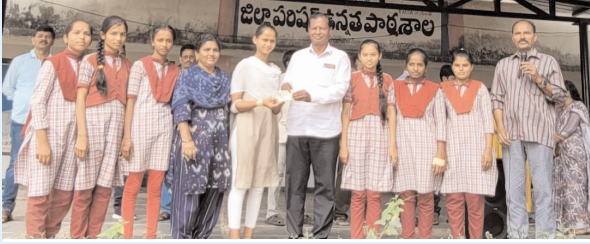
మరిపెడ, ఫిబ్రవరి 09 (ప్రజాజ్యోతి):