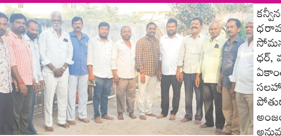
తొర్రూరు, ఫిబ్రవరి 09 (ప్రజాజ్యోతి):

విశ్వవిఖ్యాత నట సార్వభౌమ డాక్టర్ నందమూరి తారక రామారావు అభిమాన సంఘం అడహాక్ కమిటీని ఈ రోజు పాటిమీది గుడి ప్రాంగణంలో ఏకగ్రీవంగా ఎంపిక చేయడం జరిగింది. ఈ అడహాక్ కమిటీలో