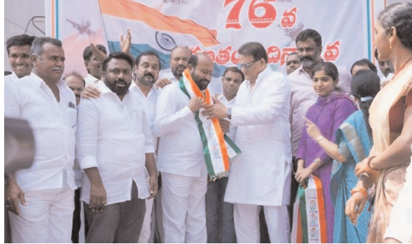
రాయపర్తి, ఫిబ్రవరి 09 (ప్రజాజ్యోతి):