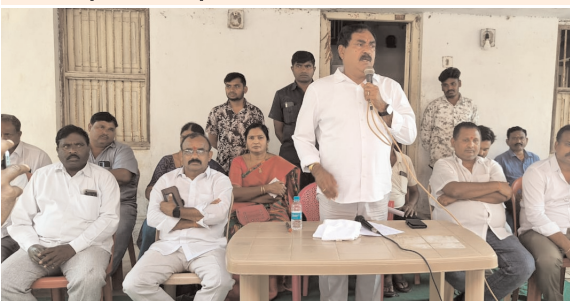
రాయపర్తి, ఫిబ్రవరి 09 (ప్రజాజ్యోతి):

రాయపర్తి మండల కేంద్రంలో బి.ఆర్.ఎస్ మండల పార్టీ ఆధ్వర్యంలో సోమవారం నిర్వహించిన మండల పార్టీ విస్తృత స్థాయి సమావేశం లో ముఖ్య అతిథిగా పాల్గొన్న రాష్ట్ర మాజీ మంత్రివర్యులు