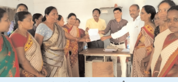
వెంకటాపురం, ఫిబ్రవరి 10 (ప్రజాజ్యోతి):