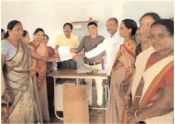
వెంకటాపురం, ఫిబ్రవరి 10 (ప్రజాజ్యోతి):

- విచారణ అధికారులకు వివరాల పత్రం అందించిన టీచర్లు