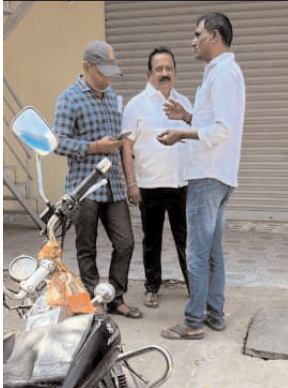
సంగం, ఫిబ్రవరి 10, (ప్రజాజ్యోతి):