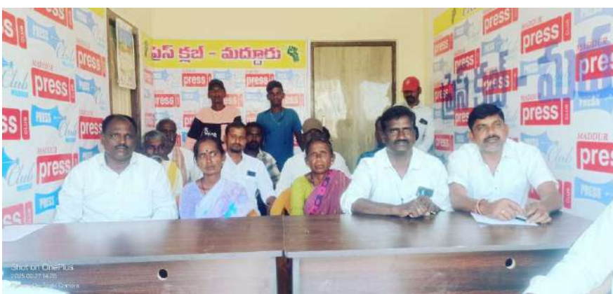
- మీడియా సమావేశంలో దళిత సంఘ నాయకులు

నారాయణపేట జిల్లా ప్రతినిధి ప్రజాజ్యోతి ఫిబ్రవరి27: