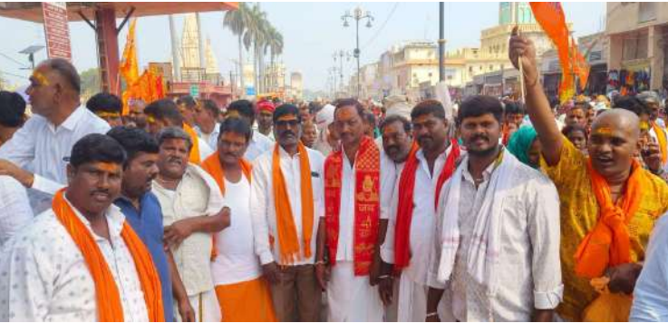
- హెహాలియా దాసరి మిత్ర బృంద సంఘం