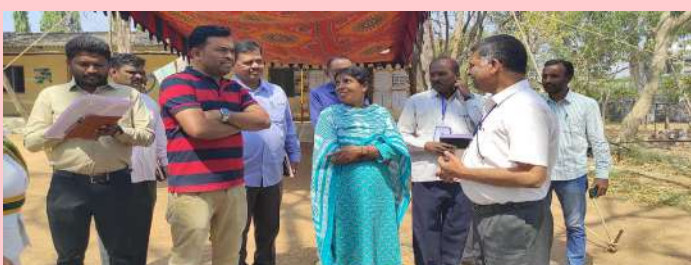
చేర్యాల ప్రజాజ్యోతి :

వరంగల్, ఖమ్మం, నల్గొండ టీచర్ ఎమ్మెల్సీ స్థానాలకు గురువారం జరిగిన ఎన్నికల పోలింగ్ చేర్యాల, మద్దూరు, కొమరవెల్లి, ధూళిట్ల, మండలాల పరిధిలోని కేంద్రంలో ఏర్పాటు చేసిన పోలింగ్ బూత్ లో ఎమ్మెల్సీ ఎన్నికలు ప్రశాంతంగా ముగిసాయి. చేర్యాల మండలం లో టీచర్స్ ఎమ్మెల్సీ 124 ఓట్లు ఉండగా 117 మంది ఓటు హక్కును వినియోగించుకున్నారు. కొమరవెల్లి మండలంలో టీచర్స్ ఎమ్మెల్సీ 6 ఓట్లు ఉండగా 5 మంది ఓటు హక్కును వినియోగించుకున్నారు. మద్దూరు మండలంలో టీచర్స్ ఎమ్మెల్సీ 28 ఓట్లు ఉండగా 27 మంది ఓటు హక్కును వినియోగించుకున్నారు. దూళిట్ల మండలంలో టీచర్స్ ఎమ్మెల్సీ 8 ఓట్లు ఉండగా 7 మంది ఓటు హక్కును వినియోగించుకున్నారు.