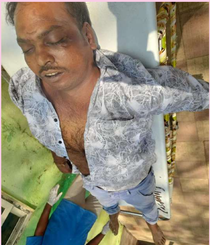
కొల్వారం (ప్రజాజ్యోతి )