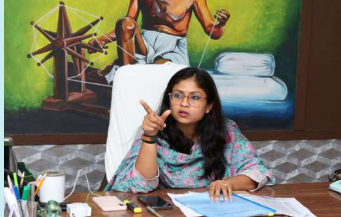
నారాయణపేట జిల్లా ప్రతినిధి ప్రజాజ్యోతి ఫిబ్రవరి27:

నారాయణపేట జిల్లాలో రానున్న వేసవిలో త్రాగునీటి ఇబ్బందులు లేకుండా అన్ని చర్యలు తీసుకోవాలని జిల్లా కలెక్టర్ సిక్తా పట్నాయక్ అధికారులను ఆదేశించారు. గురువారం కలెక్టర్ ఛాంబర్ లో మిషన్ భగీరథ బడ్జెట్ పన్నుల వసూలు పై సమీక్ష నిర్వహించారు. ఈ సందర్భంగా కలెక్టర్ మిషన్ భగీరథ గురించి మాట్లాడుతూ గ్రామ గ్రామాన మిషన్ భగీరథ త్రాగునీరు సరఫరా అవుతున్నాయని వచ్చే వేసవిలో కూడా అలాగే సరఫరా చేయాలన్నారు. ఎక్కడైనా ఇబ్బందులు ఉంటే తెలుపాలని అధికారులను ఆదేశించారు. వేసవి యాక్షన్ ప్లాన్ ప్రకారం ముందుకు వెళ్లాలని తెలిపారు. ఈ సందర్భంగా నారాయణపేట, మక్తల్, కోస్లి, మద్దూరు మున్సిపాలిటీ కమిషనర్లను ఆయా మున్సిపాలిటీలలో త్రాగునీటి సరఫరాపై పూర్తి వివరాలు తెలుసుకున్నారు. అలాగే బడ్జెట్ పై పన్నుల వసూళ్లపై మాట్లాడారు. ఈ సమావేశంలో మిషన్ భగీరథ ఈ.ఈ.మిషన్ భగీరథ గ్రిడ్ పి. వెంకటరెడ్డి, మున్సిపల్ కమిషనర్లు మిషన్ భగీరథ అధికారులు ఏ. ఈ. డి. ఈ. లు తదితరులు పాల్గొన్నారు.