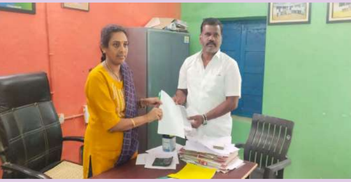
రాయపాల్ ఫిబ్రవరి 27 ప్రజా జ్యోతి