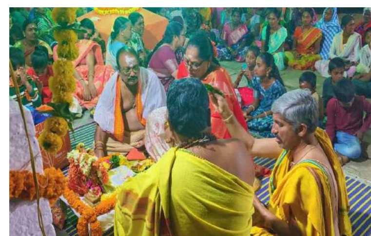
ంచారు. భక్తులకు అన్నదాన కార్యక్రమం నిర్వహించారు. ఉత్సవాలను పురస్కరించుకుని ఆలయం వద్ద జాతర జరిగింది. కల్యాణోత్సవంలో భక్తులు అధిక సంఖ్యలో పాల్గొని మొక్కులు తీర్చుకున్నారు. ఈ ఉత్సవాలలో రాయపోల్, రామారం, గొల్లపల్లి, ఉదయపూర్ చుట్టుపక్కల గ్రామాల భక్తులు అధిక సంఖ్యలో పాల్గొన్నారు.

మహాశివరాత్రి ఉత్సవాలను పురస్కరించుకుని రాయపోల్ మండల పరిధిలోని పలు గ్రామాల్లో దేవాలయాలలో శివ నామ స్మరణ తో మార్మోగాయి ఆలయాల వద్ద ఉదయం నుండి పెద్ద సంఖ్యలో భక్తులు భారులు తీరి మొక్కులు చెల్లించుకున్నారు. ప్రతి సంవత్సరం లాగే నిర్వహించే శివపార్వతుల కళ్యాణ మహోత్సవం అంగరంగ వైభవంగా నిర్వహించడానికి దేవాలయాలను విద్యుత్కాంతి దీపాలతో రంగు రంగులతో సుందరంగా వైభవంగా తీర్చిదిద్దారు. రాయపోల్ మండల కేంద్రంలో ఉమా పార్వీశ్వరాలయం బుధవారం రాత్రి శివపార్వతుల కల్యాణం మహోత్సవం ఘనంగా నిర్వహించారు. గురువారం అన్నదాన కార్యక్రమం నిర్వహించారు. రామారం గ్రామంలో మహా దేవుని దేవాలయంలో శివరాత్రి ఉత్సవాలు ఘనంగా నిర్వహించారు. రెండు రోజులుగా నిర్వహిస్తున్న శివరాత్రి ఉత్సవాలు రుద్ర హోమం, తదుపరి శివ కళ్యాణం, హారతి, మంత్రపుష్పం, తీర్థప్రసాద వితరణ, ఆశీర్వాదం నిర్వహించారు. గురువారం శివ పార్వతుల కళ్యాణ మహోత్సవం వేదపండితులు మంత్రోచ్ఛారణలతో ఘనంగా నిర్వహి