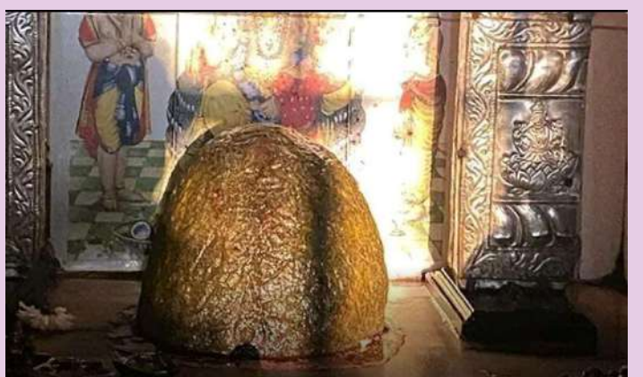
నాగర్ కర్నూల్, ఫిబ్రవరి 27 ప్రజా జ్యోతి