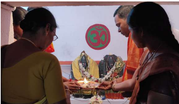
మఖిల్ నియోజకవర్గ ప్రతినిధి ఫిబ్రవరి 27 (ప్రజా జ్యోతి):