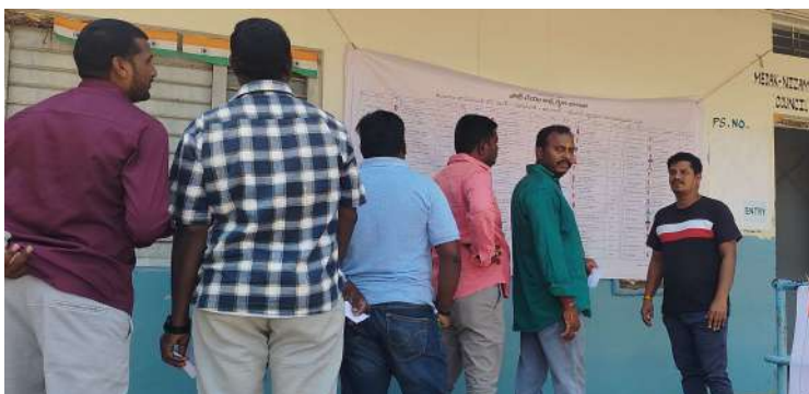
ంచుకున్నారు. టీచర్స్ ఎమ్మెల్సీ 19 ఓట్లు ఉండగా 17 మంది ఓటు హక్కును వినియోగించుకున్నారు. కాగా పోలింగ్ కేంద్రాల వద్ద ఎలాంటి అవాంఛనీయ సంఘటన జరగకుండా సీబి షేక్ లతీఫ్. ఎస్సై విక్టర్ రఘుపతి. పోలీస్ సిబ్బంది భారీ బందోబస్తు ఏర్పాటు చేశారు.

మెదక్, కరీంనగర్, నిజామాబాదు, ఆదిలాబాద్ పట్టణాలు, టీచర్ ఎమ్మెల్సీ స్థానాలకు గురువారం జరిగిన ఎన్నికల పోలింగ్ రాయపోల్ మండల కేంద్రంలో ఏర్పాటు చేసిన జిల్లా పరిషత్ ఉన్నత పాఠశాల పోలింగ్ బూత్లో ఎమ్మెల్సీ ఎన్నికలు ప్రశాంతంగా ముగిసాయి. ఉదయం మండకోడిగా మొదలైన పోలింగ్ మధ్యాహ్నం వరకు ఉపండు కుంది. ఈ ఎన్నిక బీజేపీ, కాంగ్రెస్ గ్రాడ్యూయేట్ ఎన్నికలను ప్రతిష్ట త్మాకంగా తీసుకోవడంతో పోరు రసవత్తంగా మారింది. ముఖ్యంగా యువత, నిరుద్యోగులు ఈ ఎన్నికల్లో ప్రభావం చూపనున్నారు. కాగా గతంలో కంటే ఈ ఎన్నికల్లో యువత భారీగా తరలి వచ్చి ఓటు హక్కు వినియోగించుకున్నారు. కాగా రాయపోల్ మండలంలో పట్టణాలు 506 మంది ఉండగా 414 పట్టణాలు వారి ఓటు హక్కును వినియోగి