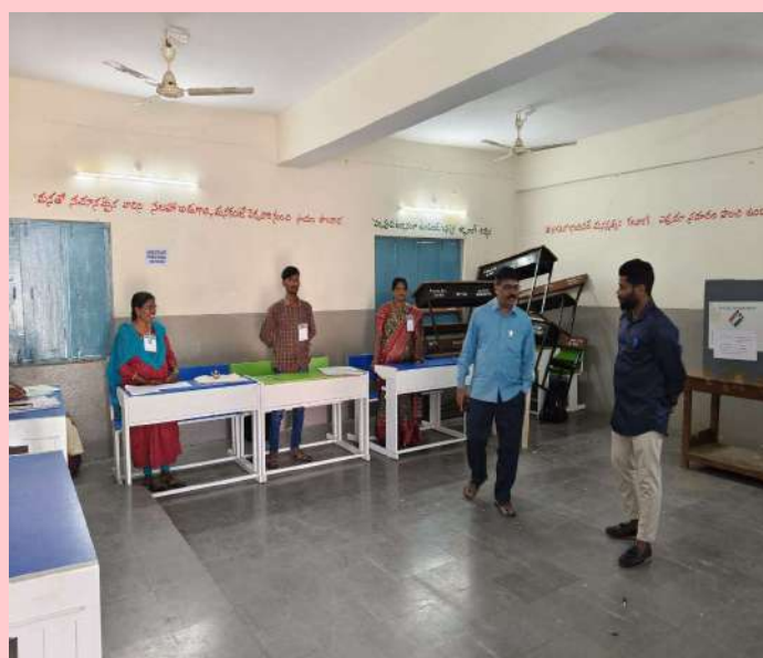
అల్లదుర్గం ఫిబ్రవరి 27 (ప్రజాజ్యోతి)