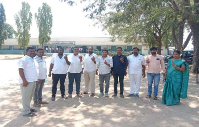
కొడిపల్లి ప్రజా జ్యోతి ఫిబ్రవరి 27