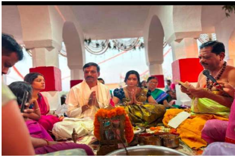
-అంగరంగ వైభవంగా శివపార్వతుల కళ్యాణోత్సవం