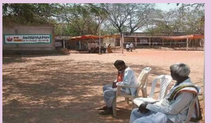
సిర్సాపూర్ ఫిబ్రవరి 27(ప్రజాజ్యోతి):

సంగారెడ్డి జిల్లా సిర్సాపూర్ మండల కేంద్రంలోని జిల్లా పరిషత్ ఉన్నత పాఠశాలలో గురువారం నాడు ఏర్పాటు చేసిన పోలింగ్ స్టేషన్లో గ్రామ్యుయేట్, టీచర్ ఎమ్మెల్సీ పోలింగ్ ప్రశాంతవంతంగా ముగిసింది. ఉదయం నుంచి ఓటర్లు ఒక్కొక్కరుగా వచ్చి ఓటు హక్కు వినియోగించుకుంటున్నారు. పోలింగ్ కేంద్రం వద్ద పోలీసులు పటిష్ట భద్రతను ఏర్పాటు చేశారు. కాగా పోలింగ్ కేంద్రం చుట్టూ పక్కల 163 బిఎన్ఎస్ఎస్ సెక్షన్ల అమలులో ఉంది. మొత్తం 28/29 - 96% వినియోగించుకున్నారు.