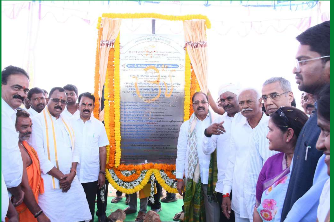
వనపర్తి ప్రతినిధి, ఫిబ్రవరి 22 (ప్రజా జ్యోతి):

దేశంలో ఉన్న మంచి నూనె కొరతను అధిగమించి ఇతర దేశాలకు ఎగుమతి చేసేస్తాయికి ఎదిగేందుకు అత్యధికంగా పామాయిల్ సాగుని పెంచాలని రాష్ట్ర వ్యవసాయ శాఖ మంత్రి తుమ్మల నాగేశ్వరరావు పిలుపునిచ్చారు. శనివారం రాష్ట్ర ఆబ్జర్వే, పర్యాటక సాంస్కృతిక శాఖ మంత్రి జూపల్లి కృష్ణారావుతో కలిసి వనపర్తి జిల్లాలో పర్యటించారు. వనపర్తికి చేరుకున్న మంత్రి, తుమ్మల నాగేశ్వర్ రావు ముందు పెద్దమండలి మండలం వెల్లూరు గ్రామంలో 20 లక్షల రూపాయల వ్యయంతో నిర్మించనున్న ఉప వైద్య కేంద్ర భవనం, మోజర్ల గ్రామ పంచాయతీ పరిధిలో రూ. 8.38 కోట్ల వ్యయంతో ఏర్పాటు చేయనున్న 10 వేల మెట్రిక్ టన్నుల సామర్థ్యం కలిగిన వ్యవసాయ గోదాముల సముదాయానికి శంఖస్థాపన చేశారు. అదేవిధంగా పెబ్బురులో రూ. 5.50 కోట్ల వ్యయంతో ఏర్పాటు చేయనున్న మరో వ్యవసాయ గోదాము 5000 మెట్రిక్ టన్నుల సామర్థ్యం కలిగినది, రూ. 44 లక్షల వ్యయంతో వ్యవసాయ కార్యాలయ అదనపు భవన నిర్మాణానికి శంఖస్థాపన చేశారు. - మిగతా2లో