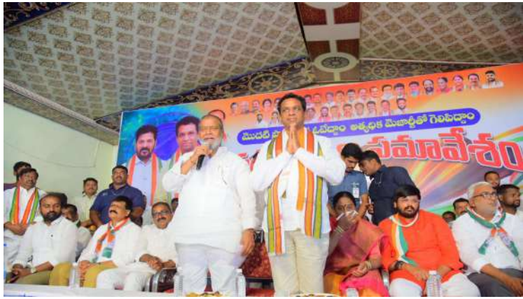
- నిర్లక్ష్యం చేయొద్దు.. గ్రామ్య యెట్స్ ఎన్నికలు..