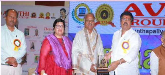
అబ్దుల్లాపూర్ మెట్టు ఫిబ్రవరి 22 (ప్రజా జ్యోతి)