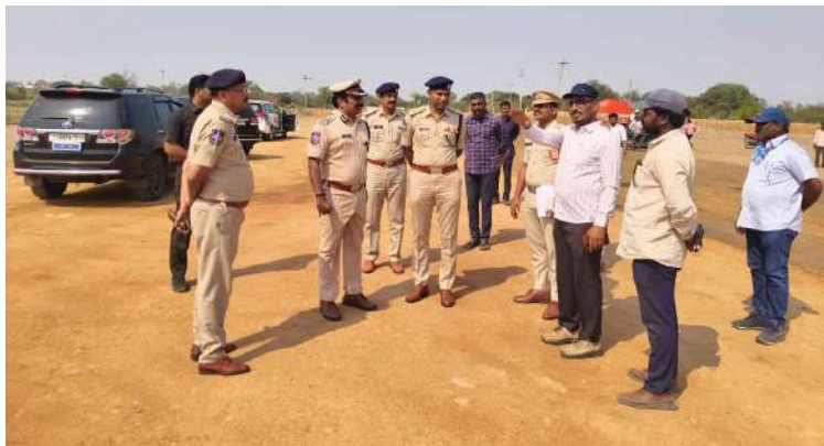
కొడంగల్ ఫిబ్రవరి 20 ప్రజా జ్యోతి స్టూస్ :-