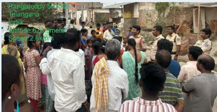
యాచారం, జనవరి 19 (ప్రజాజ్యోతి):

- సైబర్ నేరాలు, డ్రగ్స్ నియంత్రణపై విస్తృత అవగాహన