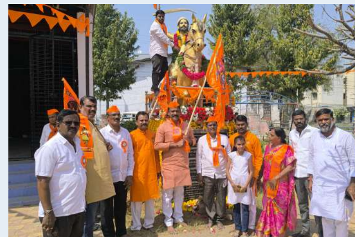
ఎన్టీసర్ ప్రజా జ్యోతి ప్రతిని