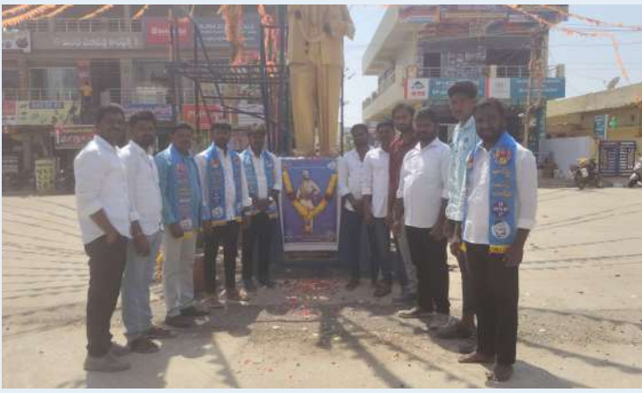
కేకంపేట ఫిబ్రవరి 19 (ప్రజా జ్యోతి)