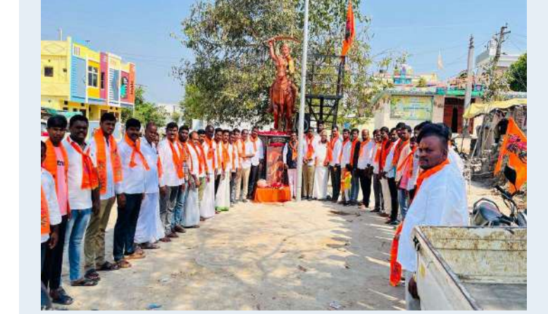
చేవ్క ఫిబ్రవరి 19(ప్రజా జ్యోతి):