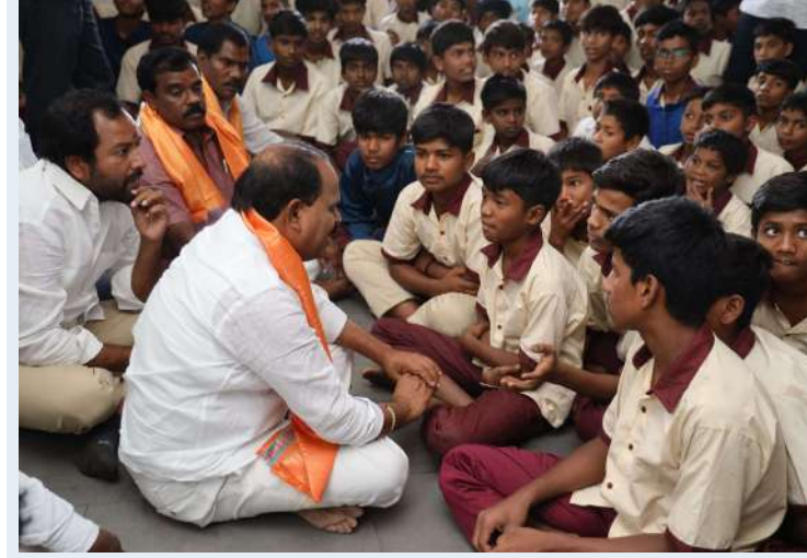
సందిగామ, ఫిబ్రవరి 19(ప్రజాజ్యోతి):

షాద్ నగర్ ఎమ్మెల్యే వీరభల్లి శంకర్ కొండుర్ల సోషల్ వెల్ఫేర్ రెసిడెన్షియల్ స్కూల్ ను అకస్మిక తనిఖీ చేసిన ఎమ్మెల్యే విద్యార్థుల సమస్యలను నేరుగా అడిగి తెలుసుకున్న ఎమ్మెల్యే