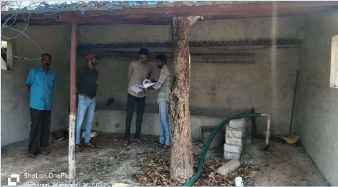
యాచారం, ఫిబ్రవరి 25 (ప్రజాజ్యోతి):

నిబంధనల మేరకు రైతులంతా నిర్మాణ పనులు చేపట్టాలని రైతులకు ఎంపీడీవో నరేందర్ రెడ్డి సూచించారు. మంగళవారం మండల పరిధిలోని చౌదర్పల్లి యాచారం గ్రామాల్లో పర్యటించి పశువుల షెడ్లు, కంపోస్ట్ గుంతలు, ఇంకుడు గుంతల ద్వారా నీటి లభ్యత కోసం బోరు బావుల్ని రీఛార్జ్ చేసుకునే విధానంతోపాటు పొట్టిషెడ్ల నిర్మాణ పనుల్ని రైతులతో కలిసి పరిశీలించారు. లబ్ధిదారులు పనుల్ని సకాలంలో పూర్తి చేసేలా అధికారులు చర్యలు చేపట్టాలన్నారు. కార్యక్రమంలో ఈసీ శివశంకర్ రెడ్డి, పంచాయతీ కార్యదర్శి తిరుపతయ్య, రైతులు ఉన్నారు.