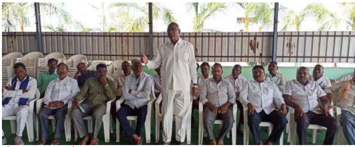
టీఆర్ఎస్ - బీజేపీ చీకటి ఒప్పందం