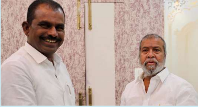
వనపర్తి ప్రతినిధి, ఫిబ్రవరి 25 (ప్రజా జ్యోతి):