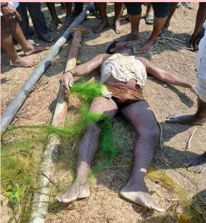
వెల్దుర్తి (ప్రజా జ్యోతి) ఫిబ్రవరి 25.