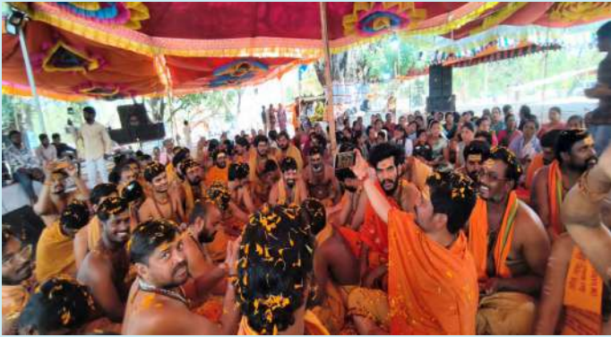
జహీరాబాద్, ఫిబ్రవరి 25 (ప్రజా జ్యోతి స్టూన్ )