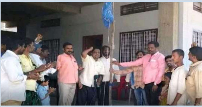
నాగర్ కర్నూల్, 25 ప్రజా జ్యోతి

నాగర్ కర్నూల్ జిల్లాలో మంగళవారం NPRD వికలాంగుల సంఘం 15వ అభిర్వావ దినోత్సవాన్ని ఘనంగా జరుపుకున్నారు. ఈ సందర్భంగా సిబిఐయూ కార్యాలయంలో సంఘం జెండా ఆవిష్కరించిన అనంతరం సంఘం నాయకులు మాట్లాడుతూ గత 15 ఏళ్లలో వికలాంగుల సంక్షేమం కోసం అనేక పోరాటాలు నిర్వహించామని, పలువురు లబ్ధి పొందాలని దేశవ్యాప్తం గా రూపాయలు 5000 పెన్షన్ అమలు కోసం కొనసాగుతున్న ఉద్యమాన్ని మరింత బలపరిచేందుకు కృషి చేస్తామన్నారు.