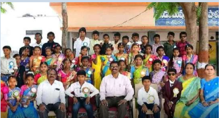
నాగర్ కర్నూల్, ఫిబ్రవరి 25 ప్రజా జ్యోతి