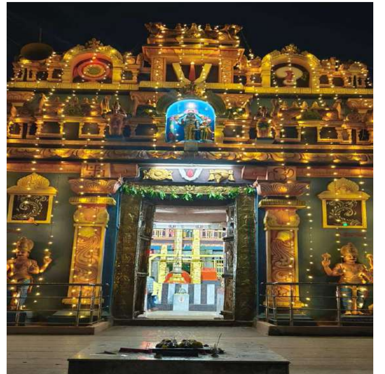
చేపట్టాలి ఫిబ్రవరి 25(ప్రజా జ్యోతి):