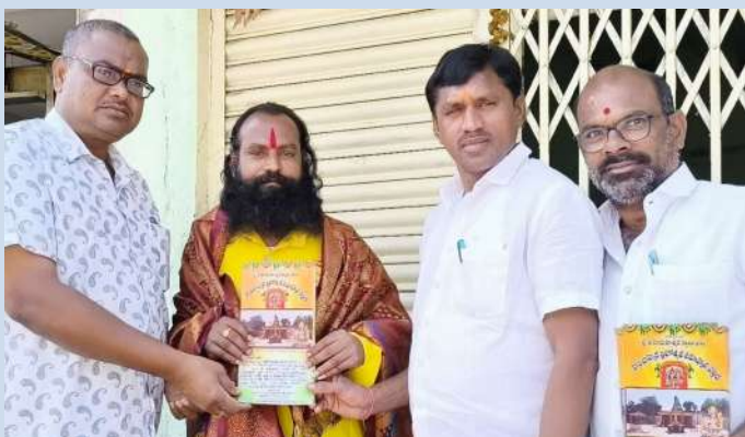
రాయపోల్ ఫిబ్రవరి 25 ప్రజా జ్యోతి: