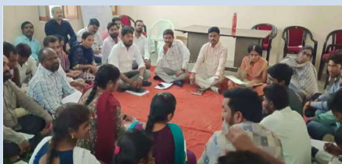
జగదేవపూర్: ఫిబ్రవరి 25 ప్రజాజ్యోతి