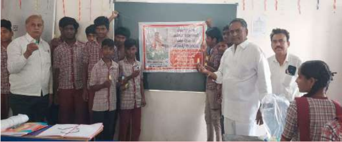
(కుత్బుల్లాపూర్ ఫిబ్రవరి 24(ప్రజా జ్యోతి )

- కుంభమేళా ప్రయోగరాజ్ త్రివేణి సంగమం నుండి పవిత్రమైన జ లాల ను 50 మిల్లీమీటర్ల చొప్పున బాటలు తయారుచేసి 1500 మంది భక్తులకు జిల్లా పరిషత్ హై స్కూల్ సూరారం విద్యార్థులకు భక్తులకు పంపిణీ చేశారు