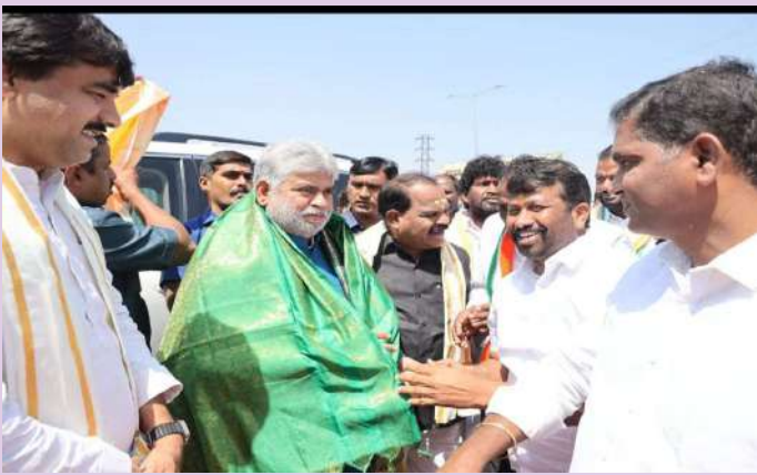
నందిగామ, ఫిబ్రవరి 24 (ప్రజాజ్యోతి):