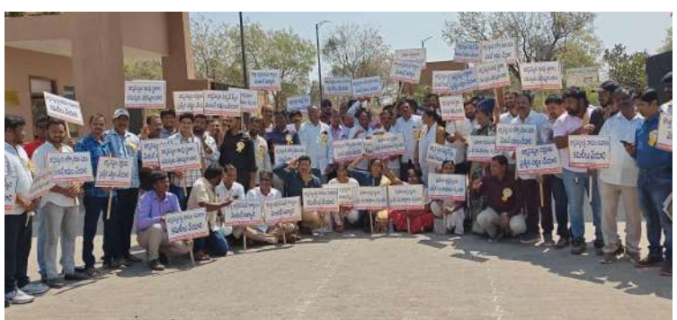
- మేడ్చల్ కలెక్టర్ కార్యాలయం ముందు జర్నలిస్టుల నిరసన