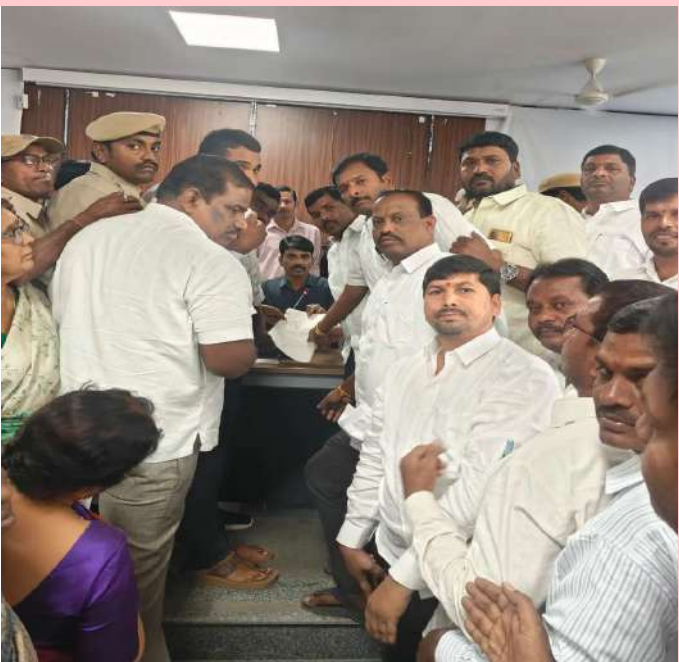
చేవెళ్ల ఫిబ్రవరి 24(ప్రజా జ్యోతి):