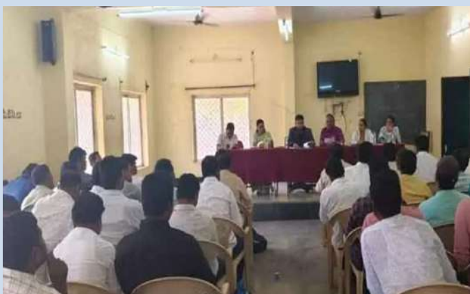
జహీరాబాద్, ఫిబ్రవరి 24 (ప్రజా జ్యోతి న్యూస్ )