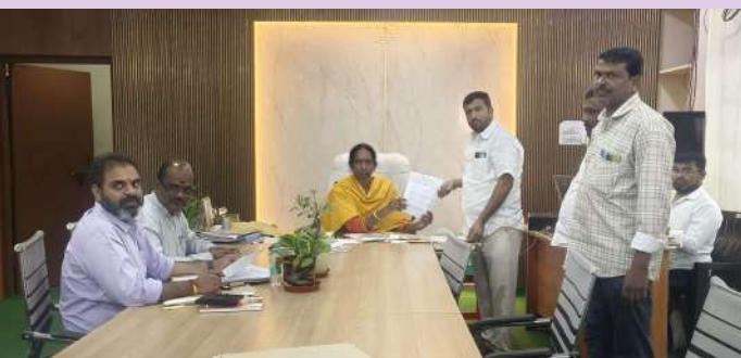
చేవెళ్ల ఫిబ్రవరి 24(ప్రజా జ్యోతి):

- ప్రజలు ప్రజావాణిని సద్వినియోగం చేసుకోవాలి - చేవెళ్ల ఆర్డిఓ చంద్రకళ