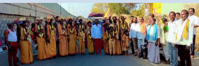
అల్లారుగ్గం ఫిబ్రవరి 24 (ప్రజాజ్యోతి)