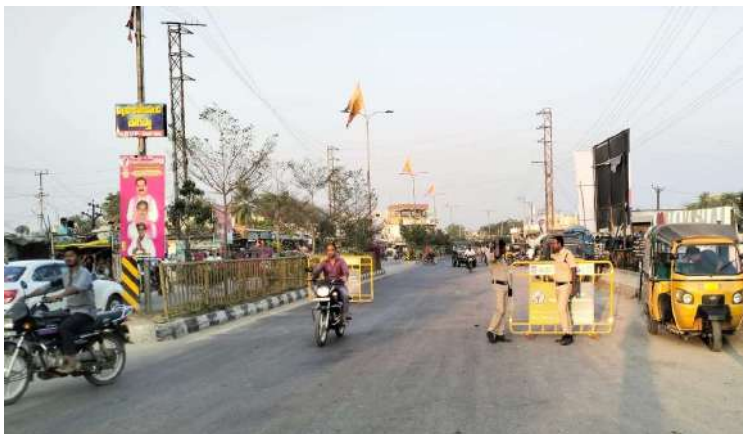
స్పష్టంగా కనిపించే విధంగా చేయడం జరిగిందని ఎస్ఐ తెలిపారు. రోడ్డు ప్రమాదాల నివారణకు వాహనదారులు ట్రాఫిక్ నిబంధనలు పాటించాలని, వాహనాలు నడిపించే సమయంలో రహదారిపై సైన్ బోర్డ్స్ గమనిస్తూ వాహనాలు నడపాలని, మితి మీరిన వేగంతో వాహనాలు నడపరాదని తెలిపారు. వాహనదారులు సీట్ బెల్టు హెల్మెట్ ధరించి వాహనాలు నడపాలని, మద్యం సేవించి వాహనాలు నడపరాదని తెలిపారు.