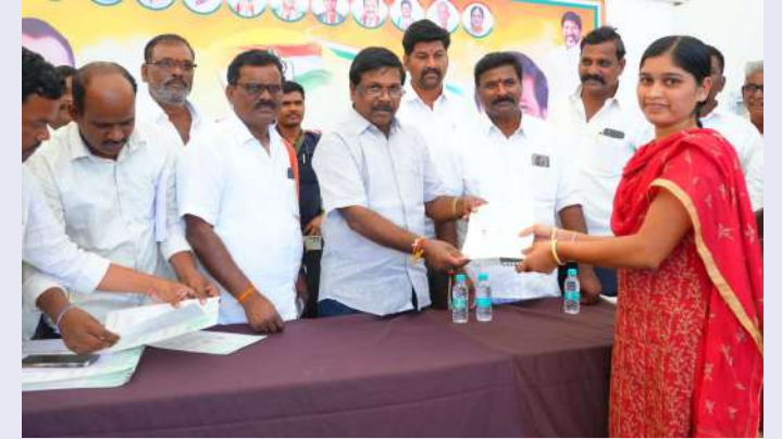
నాగర్ కర్నూల్ మార్చి 7 (ప్రజా జ్యోతి ప్రతినీధి)

ఎంతో ప్రతిష్ఠాత్మకంగా భావించి పీడిత తాడిత పేద ప్రజలకు భరోసాగా నిలుస్తున్న సిఎంఆర్ఎఫ్ ఫండ్ ఒక సంజీవ వరప్రదాయినిగా పేద ప్రజలకు పనిచేస్తుందని అచ్చంపేట ఎమ్మెల్యే వంశీకృష్ణ పేర్కొన్నారు. శుక్రవారం అచ్చంపేట పట్టణంలోని క్యాంప్ కార్యాలయంలో వివిధ రోగాలతో బాధపడుతున్న వివిధ మండలాలకు చెందిన వారికి మంజూరైన సీఎంఆర్ఎఫ్ ప్రాసీడింగ్ కాపీలను లబ్ధిదారులకు స్థానిక మున్సిపల్ చైర్మన్ గార్లపాటి శ్రీనివాసులతోపాటు వివిధ మండలాలకు చెందిన నాయకులతో కలిసి అందజేశారు. అనంతరం ఎమ్మెల్యే వంశీకృష్ణ మాట్లాడుతూ సి ఎం ఆర్ ఎఫ్ తో పేద ప్రజలకు కార్పొరేట్ స్థాయిలో వైద్యం అందించడంతోపాటు ప్రాణాలు కాపాడడం జరుగుతుందని సీఎంఆర్ఎఫ్ పేద ప్రజలకు వరంతో పాటు భరోసా కల్పిస్తుందని ఈ సందర్భంగా ఆయన గుర్తు చేశారు. అదేవిధంగా తెలంగాణ రాష్ట్రంలోని తాడిత పీడిత ప్రజలకు తెలంగాణ రాష్ట్రం పేద ప్రజల సంక్షేమ కోసం అవార్జునలు పాటుపడుతుందని ఎమ్మెల్యే వ్యాఖ్యానించారు. అదే మాదిరిగా లక్షలు ఖర్చు చేసి కార్పొరేట్ స్థాయిలో వైద్యం చేయించుకోలేని వారికి సీఎంఆర్ పథకం కొండంత అండగా ఉంటుందన్నారు. ఈ కార్యక్రమంలో నాయకులతోపాటు లబ్ధిదారులు తదితరులు పాల్గొన్నారు.