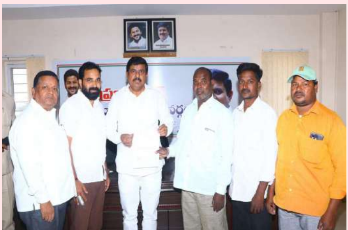
తాండూర్ ఫిబ్రవరి 7 ప్రజా జ్యోతి :-

-రూ 2లక్షల 50వేల ఎల్ఓసీని అందించిన ఎమ్మెల్యే