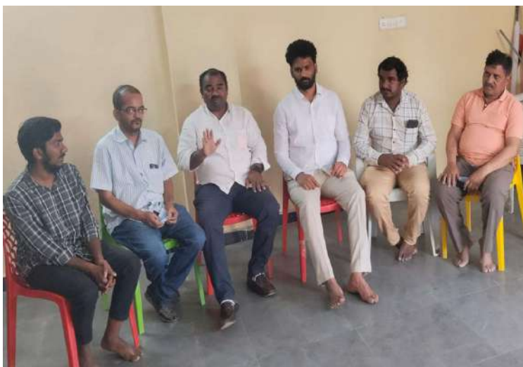
-చెరువుల పరిరక్షణ కమిటీ