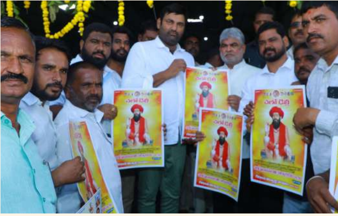
జడ్పర్ల : ఫిబ్రవరి 7 (ప్రజా జ్యోతి)