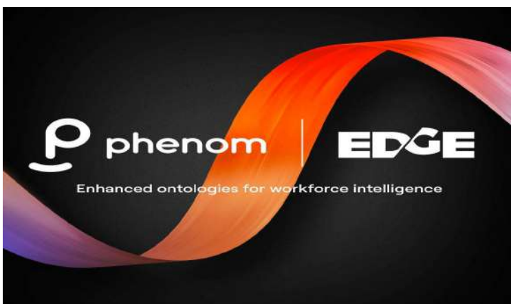
సంఖ్యను రెట్టింపు చేయాలని లక్ష్యంగా పెట్టుకున్నట్లు తెలిపారు. దేశ వ్యాప్తంగా మరిన్ని కార్యాలయాలను ప్రారంభించేందుకు ప్రణాళికలు సిద్ధమవుతున్నట్లు తెలిపారు.