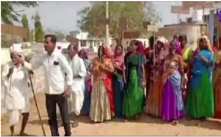
-కొడంగల్ లో మళ్ళీ ఉద్రిక్తత మళ్ళీ రగిలిన లగచర్ల షకార్లతో నిరసన

కొడంగల్ ఫిబ్రవరి 07 ప్రజా జ్యోతి న్యూస్: వికారాబాద్ జిల్లా కొడంగల్ నియోజకవర్గంలోని దుద్దాల మండలం లగచర్ల లో ఇండస్ట్రియల్ కారిడార్ ఏర్పాటుకు అధికారులు భూసర్వే కోసం రోటీబండ్ తండా కు వచ్చిన సందర్భంగా తండా వాసులు పెద్దసంఖ్యలో వచ్చి చేతిలో షకార్లు పట్టుకుని నిరసన తెలియజేస్తూ అధికారులను అడ్డుకున్నారు. ఇటీవలే పార్కు సీటీ భూసేకరణ సర్వే కోసం వెళ్లిన కలెక్టర్, అధికారుల పై దాడి జరిగిన విషయం తెలిసిందే, అదే కేసులో BRS మాజీ MLA సరేందర్ రెడ్డి సహా పలువురు రైతులు అరెస్టు అయ్యి బెయిల్ పై బయటకు వచ్చారు, ఈ క్రమంలో ప్రభుత్వం పార్కు