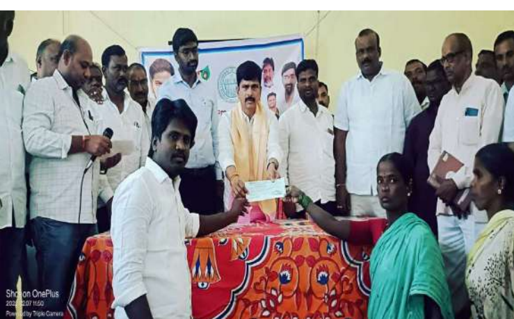
-మద్దూర్, కొత్తపల్లి మండలంలో కళ్యాణ లక్ష్మీ, సీఎంఆర్ఎఫ్ చెక్కుల పంపిణీ