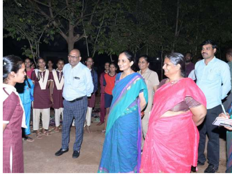
- సెర్ప్ సీకూ ఒ దివ్యాదేవరాజన్