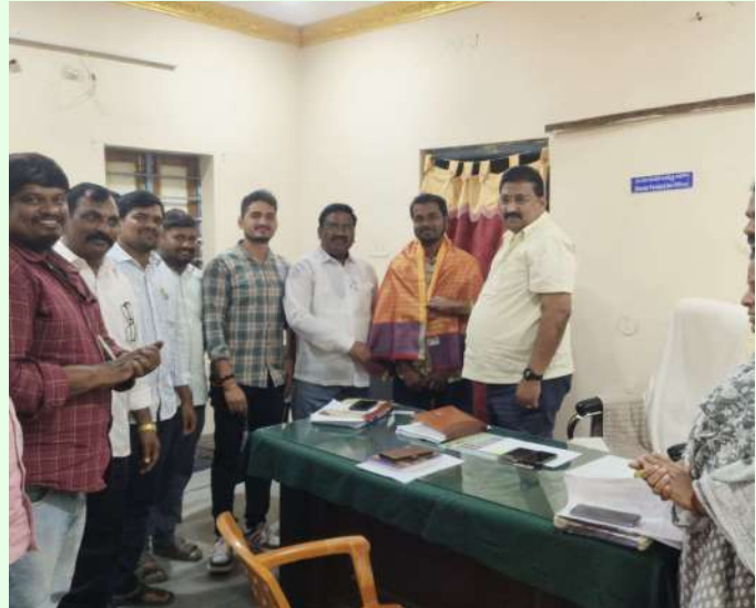
ప్రజా జ్యోతి, ప్రతినిధి బీర్హూర్, 07 ఫిబ్రవరి.