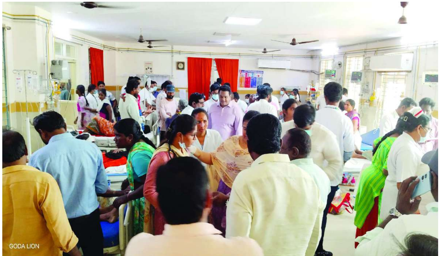
అధికంగా జరుగుతున్న నేపథ్యంలో వాటిని నివారించడంలో ప్రభుత్వ అధికారులు విఫలం చెందారని, ప్రభుత్వం వలస కూలీలలో అరికట్టటానికి ప్రభుత్వాలు కృషి చేయాలని, ఇటువంటి ప్రమాదాల వలన కుటుంబాలు రోడ్డున పడకుండా కాపాడాల్సిన బాధ్యత ప్రభుత్వాలు తీసుకోవాలని, బాధిత