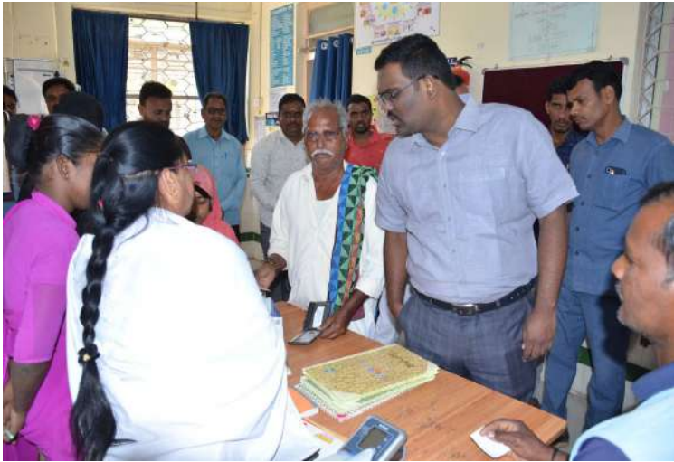
ఎడపల్లి పీ.హెచ్.సీ ఆకస్మిక తనిఖీ