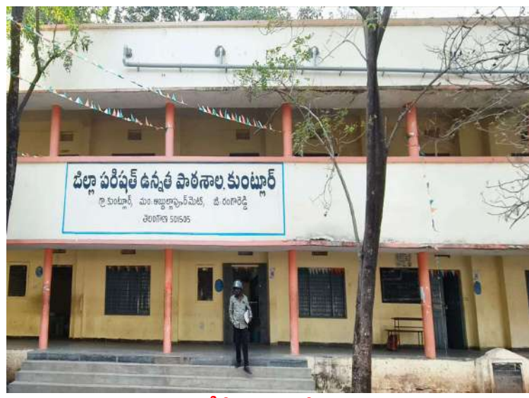
-తాళాలు పగలగొట్టి టీవీ బ్యాటరీలు ఎత్తుకెళ్లిన దుండగులు