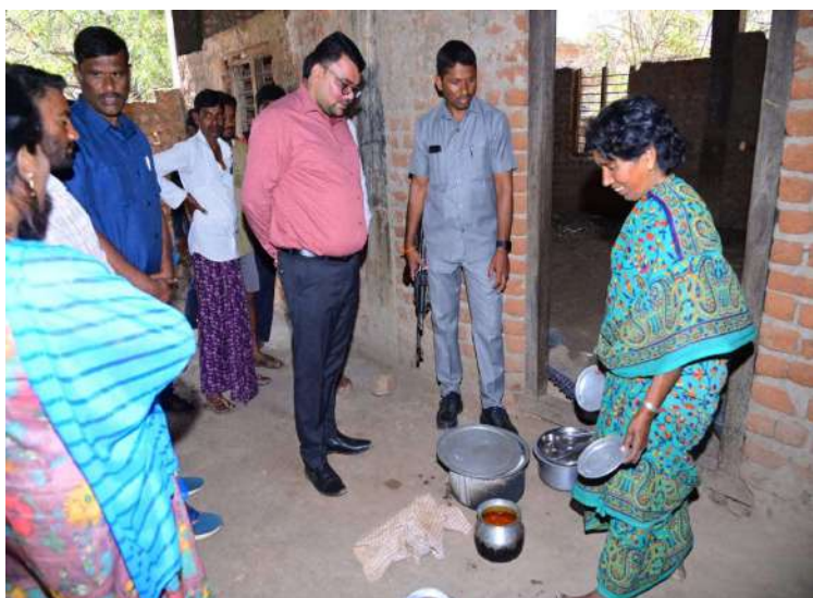
-విద్యార్థులపై ప్రత్యేక శ్రద్ధ చూపాలి -పాఠశాల తనిఖీలో జిల్లా కలెక్టర్ బాధవత్ సంతోష్