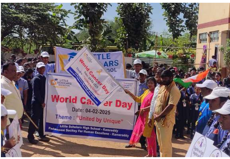
-ప్రపంచ క్యాన్సర్ అవగాహన కార్యక్రమం