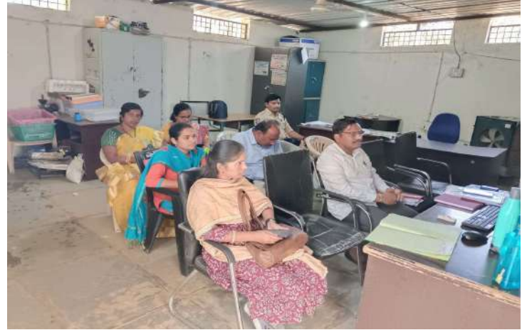
రాజంపేట ఫిబ్రవరి 3