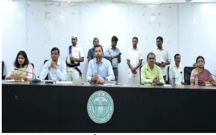
కొడంగల్ ఫిబ్రవరి 03 ప్రజా జ్యోతి న్యూస్ :