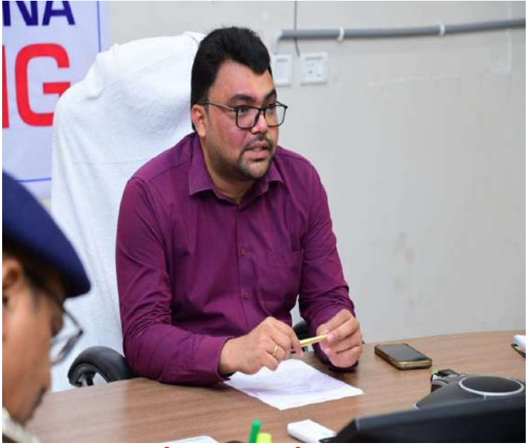
-అభివృద్ధి పనులతో గ్రామ రూపురేఖలు మారాలి