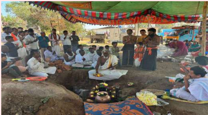
నాగిరెడ్డిపేట్, ఫిబ్రవరి 3 (ప్రజా జ్యోతి):

వసంత పంచమి పర్వదినం సందర్భంగా నాగిరెడ్డిపేట్ మండల కేంద్రంలోని గోపాల్ పేట్ లో సోమవారం స్థానిక అయ్యప్ప సేవా సమితి ఆధ్వర్యంలో అయ్యప్ప స్వామి నూతన ఆలయ నిర్మాణానికి శంకుస్థాపన కార్యక్రమాన్ని నిర్వహించారు.