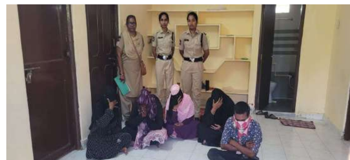
ప్రజాజ్యోతి నిజామాబాద్ క్రైమ్: