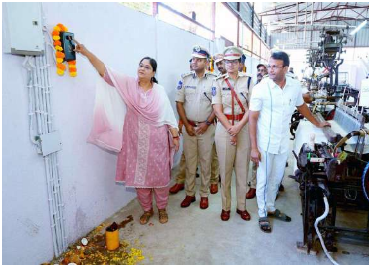
ప్రజాజ్యోతి నిజామాబాద్ ప్రతినీధి: