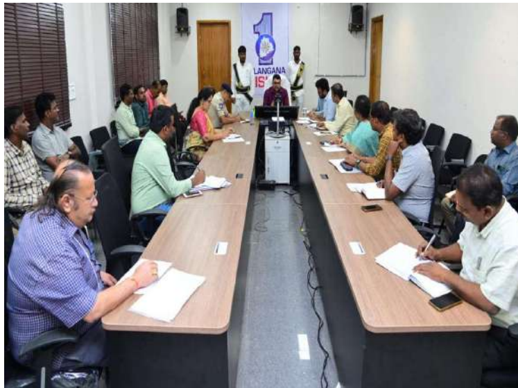
-ఆహార భద్రత అమలులో అధికారుల పాత్ర కీలకం -అధికారుల సమీక్షలో కలెక్టర్ బాధావత్ సంతోష్