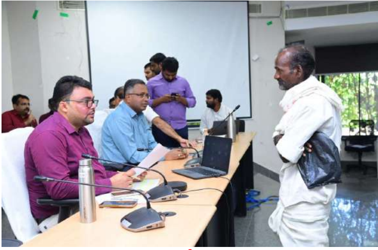
-జిల్లా కలెక్టర్ బాధావత్ సంతోష్