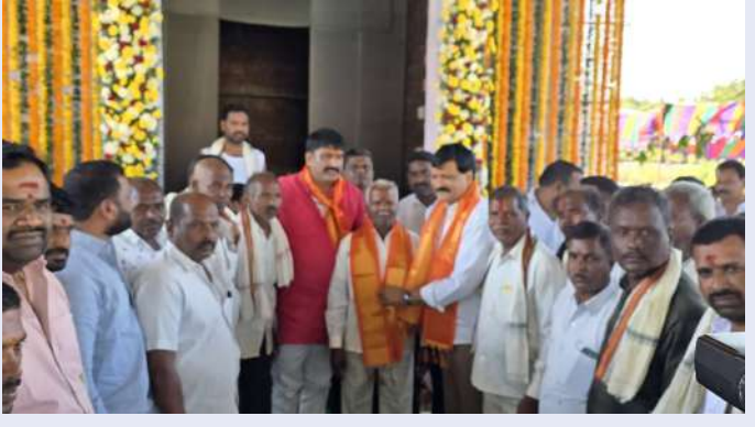
మనోహరాబాద్, ఫిబ్రవరి 03 ( ప్రజా జ్యోతి )

- ముఖ్యఅతిథిగా మల్లాజిరి మాజీ ఎమ్మెల్యే మైనంపల్లి హనుమంతరావు రాష్ట్ర కాంగ్రెస్ నాయకులు చిట్టుల మహిపాల్ రెడ్డి