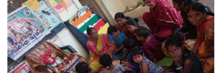
మోమినేట్ ఫిబ్రవరి 3 (ప్రజా జ్యోతి )

మోమినేట్ పేట మండలం కొత్త కోల్కుంద గ్రామంఅంగన్వాడీ కేంద్రంలో సోమవారం నాడు వసంత పంచమి వేడుకలనుఘనంగా జరుపుకున్నారు. ఈ సందర్భంగా ఆయా గ్రామ లలో అంగన్వాడీ టీచర్లు సరస్వతి దేవి చిత్రలేఖమునకు ప్రత్యేక పూజలు చేసినారు.సంప్రదాయబద్ధంగా చదువుల తల్లి సరస్వతి మాత పూజలు చేసి,చిన్నారి విద్యార్థులకు వారి తల్లిదండ్రుల సమక్షంలో అక్షరాభ్యాసాన్ని జరిపారు.అలాగే చిన్నారులకు సీట్లు పంపిణీ చేశారు. ఈ కార్యక్రమంలో అంగన్వాడీ టీచర్స్, ఆయలు, చిన్నారులు పాల్గొన్నారు