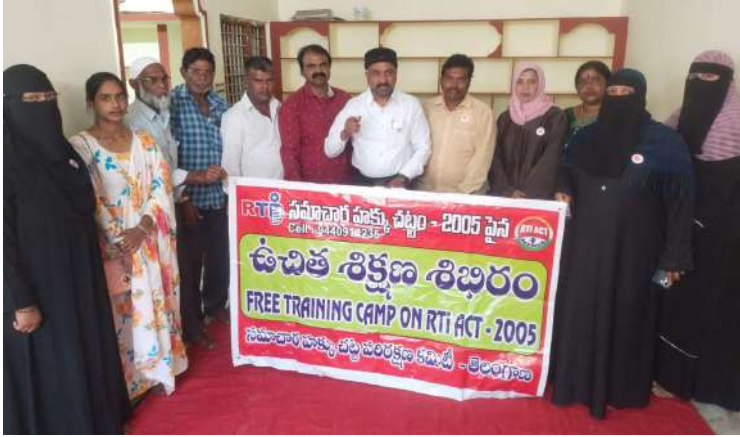
రాజంపేట (కామారెడ్డి) ఫిబ్రవరి 3 (ప్రజా జ్యోతి)