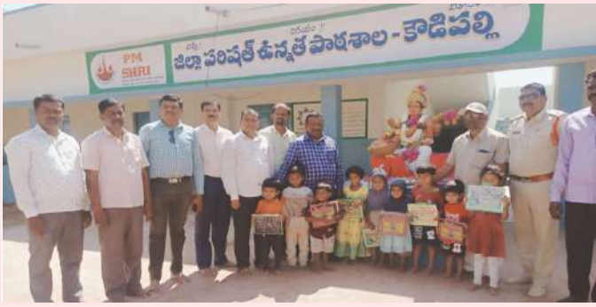
కొడిపల్లి ప్రజా జ్యోతి ఫిబ్రవరి 3