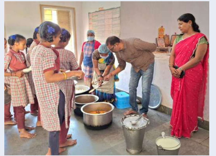
రెంజల్, ఫిబ్రవరి 03(ప్రజాజ్యోతి):