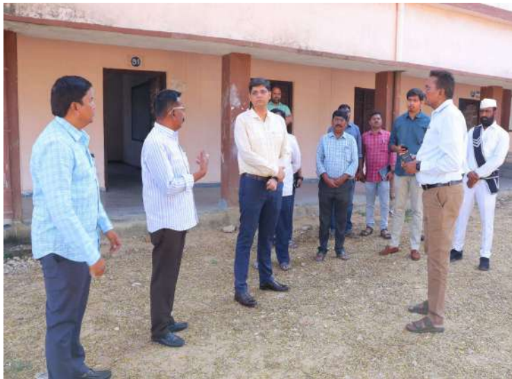
రాజంపేట (కామారెడ్డి) ఫిబ్రవరి 3 (ప్రజా జ్యోతి)