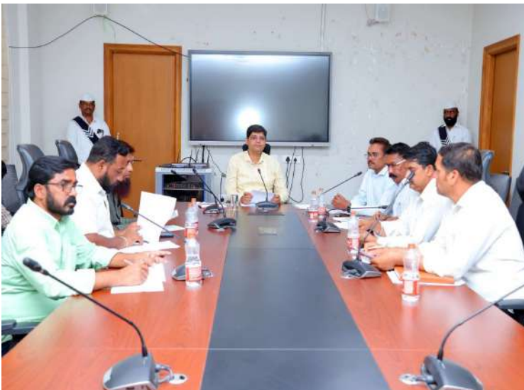
రాజంపేట (కామారెడ్డి) ఫిబ్రవరి 3 (ప్రజా జ్యోతి)