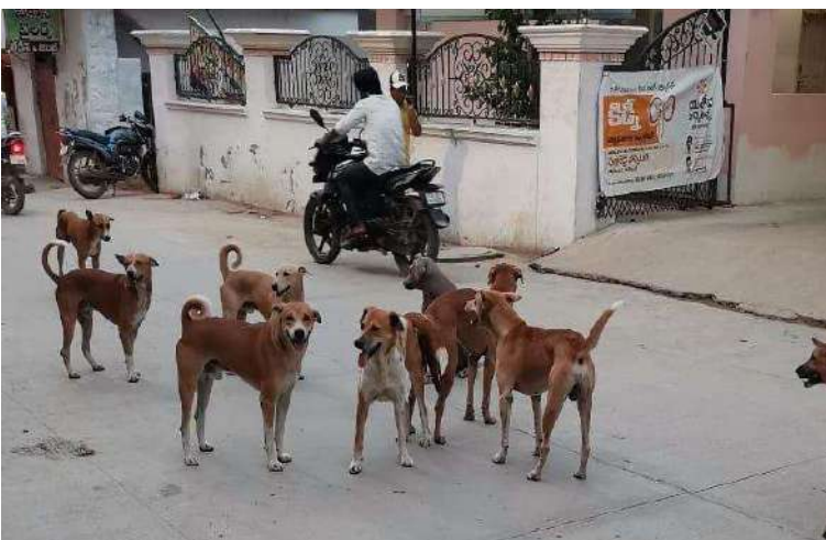
-ఐదు రోజులుగా ప్రజలపై తిరగబడుతున్న వైరం -కుక్కకాటుతో బెంబేలెత్తుతున్న జనం -పట్టణంలోని మున్సిపల్ అధికారులు, సిబ్బంది

నాగర్ కర్నూల్, (టౌన్) జనవరి 03 ప్రజా జ్యోతి