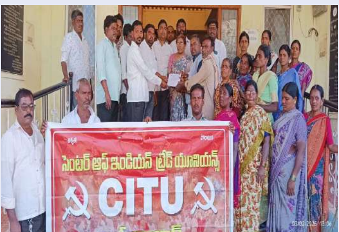
జూపీరాబాద్, ఫిబ్రవరి 03 ( ప్రజా జ్యోతి న్యూస్ )