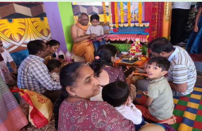
జహీరాబాద్, ఫిబ్రవరి 02 ( ప్రజా జ్యోతి న్యూస్ )

సంగారెడ్డి జహీరాబాద్ పట్టణంలోని శ్రీ సరస్వతి మందిరంలో వసంత పంచమి వేడుకలను ఘనంగా నిర్వహించారు. మందిరంలో తెల్లవారు ఝామున గణపతి పూజ, శ్రీ సూక్తం, అభిషేకం, విశేష పంచామృత అభిషేకాన్ని నిర్వహించి సరస్వతి అమ్మవారికి ప్రత్యేక అలంకరణ చేశారు. తెల్లవారుఝామున సరస్వతి మందిరం ఎదుట అమ్మవారి పాటలను, భజనలతో నగర సంకీర్తన కార్యక్రమాన్ని నిర్వహించడం విశేషం. అమ్మవారి పుట్టిన రోజు సందర్భంగా పలువురు భక్తులు అమ్మవారి దర్శనం చేసుకున్నారు. వసంత పంచమి సందర్భంగా చిన్నవారులతో అక్షరాభ్యాసాన్ని చేయించడానికి పిల్లల తల్లి దండ్రులు అధికసంఖ్యలో వచ్చి అభ్యాసం చేయించారు.