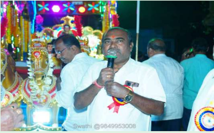
జహీరాబాద్, ఫిబ్రవరి 02 ( ప్రజా జ్యోతి న్యూస్ )