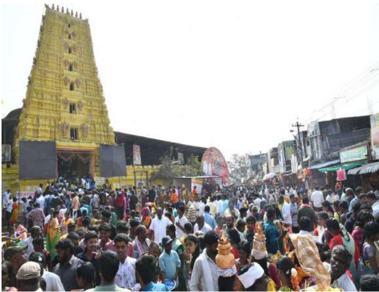
-ఆలయ ప్రాంగణంలో మల్లన్న నామస్మరణ