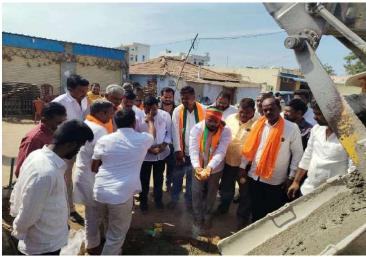
మోమిన్ పెట్ ఫిబ్రవరి 2 (ప్రజా జ్యోతి)