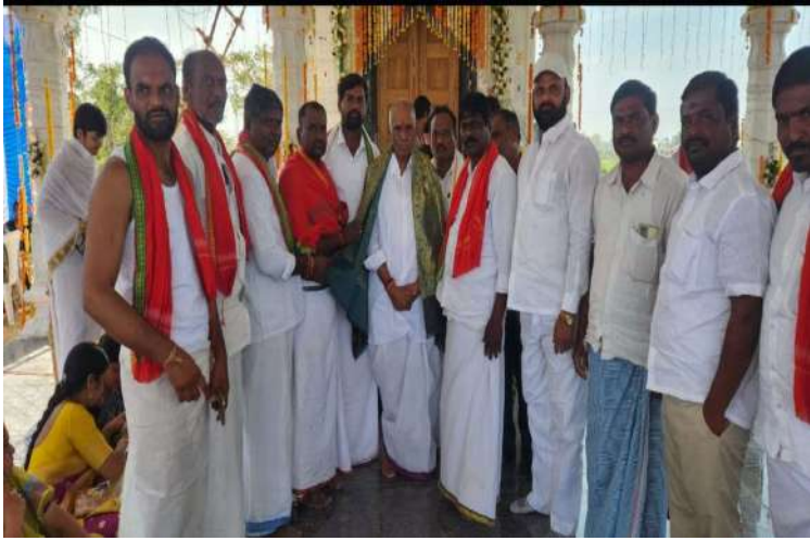
-వైభవంగా రేణుకా మాతా