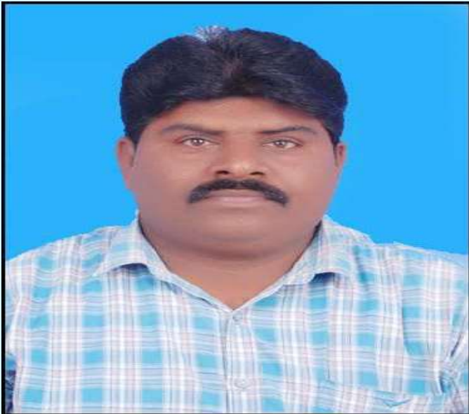
కొడంగల్ ఫిబ్రవరి 02 ప్రజా జ్యోతి న్యూస్ :