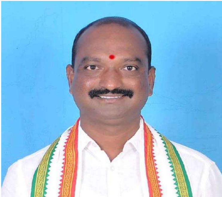
ప్రభుత్వం మొసలి కన్నీరు కారుస్తున్నదని అన్నారు. ఈ బడ్జెట్ సంపన్నులకు కొమ్ముకాసీలా ఉందని విమర్శించారు.

కేంద్ర ఆర్థిక శాఖ మంత్రి నిర్మల సీతారామన్ ప్రవేశపెట్టిన బడ్జెట్ అంకెల గారడీ లాగా ఉందని కాంగ్రెస్ పార్టీ మండల అధ్యక్షుడు మల్లేష్ గౌడ్ ఎద్దేవా చేశారు. బడ్జెట్ రైలుకు అనేక ఇంజన్లు ఉన్నాయని దీంతో అది కాస్త పట్టాలు తప్పిందని అన్నారు. దేశంలో ద్రవ్యోల్బణం పేదరికం నిరుద్యోగం వంటి తీవ్రమైన సమస్యలు ఉండటంతో పాటు రోడ్లు నీరు వంటి ప్రాథమిక సౌకర్యాలు లేక ప్రజలు ఇబ్బందులు గురవుతున్నారని అన్నారు. నిరుద్యోగులు మహిళలు ఇలా అన్ని రంగాల వారికి మరోసారి కేంద్ర బిజెపి ప్రభుత్వం మోసం చేసిందని అన్నారు. కేవలం బీహార్ రాష్ట్రంలో ఎన్నికలు ఉన్నందున ఆ రాష్ట్రానికి బడ్జెట్లో పెద్దపీట వేయడం కచ్చితంగా రాజకీయ ప్రయోజనాల కోసమేనని అన్నారు. మెదక్ జిల్లాలో రైలు రోడ్లు నిర్మాణానికి ఉపాధి రంగాల ఏర్పాటు చేయడంలో కేంద్ర ప్రభుత్వం పూర్తిగా ప్రజలను మోసం చేసిందని అన్నారు. దేశంలో అధిక జనాభా కలిగి ప్రజలు చాలా ఇబ్బందుల్లో ఉన్నారని కేంద్ర ప్రభుత్వం బడ్జెట్ ప్రవేశపెడితే తమ జీవితాల్లో వెలుగులు నింపుతాయనుకుంటే బిజెపి ప్రభుత్వం ప్రజలను మళ్లీ చీకటి లోకి నెట్టేలా బడ్జెట్ ఉందని అన్నారు. ఎన్నడూ లేనిది వ్యవసాయ రంగాలపై రైతులపై కేంద్ర