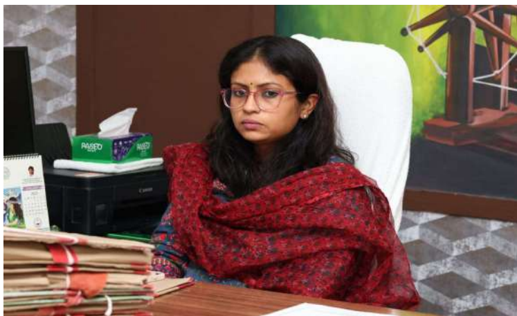
నారాయణపేట జిల్లా ప్రతినిధి ప్రజాజ్యోతి ఫిబ్రవరి01:

గ్రామపంచాయతీ ఎన్నికలకు అధికారులు సన్నద్ధం కావాలని జిల్లా కలెక్టర్ సిక్తా పట్నాయక్ సూచించారు. శనివారం కలెక్టరేట్ లోని తన ఛాంబర్ లో జిల్లాకు చెందిన నోడల్ అధికారులతో సమావేశం నిర్వహించారు. ఈ సందర్భంగా గ్రామపంచాయతీ ఎన్నికల విధుల నిర్వహణ బాధ్యతలను నోడల్ అధికారులకు అప్పగించారు. ఇప్పటికీ ఓటర్ జాబితా పోలింగ్ కేంద్రాలకు సిద్ధం చేయగా ఎన్నికల పర్యవేక్షకులకు సంబంధించి 12 మంది అధికారులను నియమిస్తూ జిల్లా కలెక్టర్ ఉత్తర్వులు జారీ చేశారు. ఒక్కో అంశంపై ఒక్కో అధికారిని