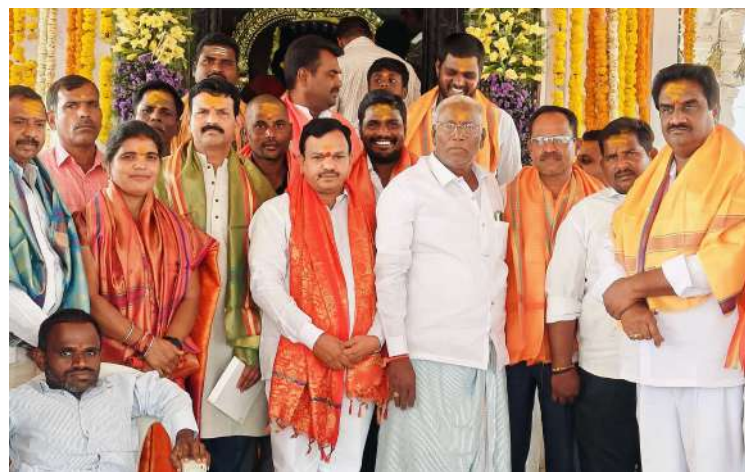
కొడిపల్లి ప్రజా జ్యోతి ఫిబ్రవరి 11

మండల పరిధిలోని వెంకట్రావుపేట్ గ్రామంలో గౌడ సంఘం ఆధ్వర్యంలో నూతనంగా నిర్మించిన శ్రీ రేణుక ఎల్లమ్మ తల్లి ఆలయ విగ్రహ ప్రతిష్ఠ మహోత్సవంలో భాగంగా మంగళవారం శ్రీ రేణుక ఎల్లమ్మ తల్లికి ఘనంగా బోనాలు తీశారు. ముందుగా గౌడ సంఘం కల్ల డిపో వద్ద అందంగా ముస్తాబు చేసిన బోనాలు గ్రామ దేవత పోచమ్మకు డప్పు చప్పులతో తీసుకెళ్లి భోనం సమర్పించారు. సాయంత్రం అందంగా