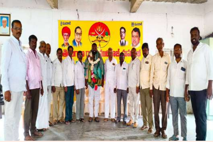
షాబాద్ ఫిబ్రవరి 11(ప్రజా జ్యోతి)

గుడిమల్కాపూర్, వ్యవసాయ మార్కెట్ కమిటీ వైస్ చైర్మన్ గా ఎన్నికైన సందర్భంగా షాబాద్ మండల ముదిరాజ్ సంఘం ఆధ్వర్యంలో సన్నాహ కార్యక్రమం