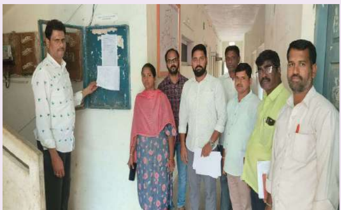
యాచారం, ఫిబ్రవరి 11 (ప్రజాజ్యోతి):