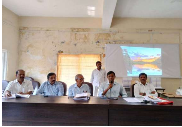
-ఎన్నికల షెడ్యూల్ ఎప్పుడు వచ్చినా అధికారులు సిద్ధంగా ఉండాలి