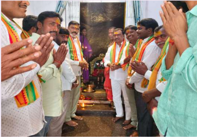
కుత్బుల్లాపూర్ ఫిబ్రవరి 11(ప్రజా జ్యోతి )