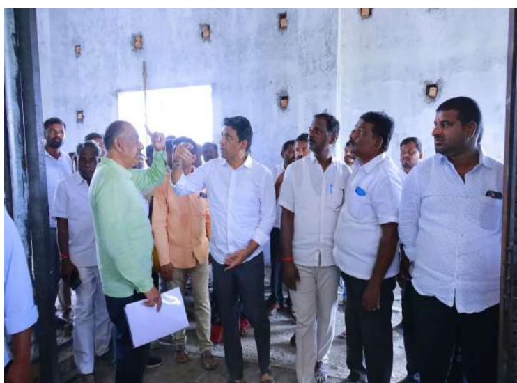
-ఎన్నికలలో ఇచ్చిన ప్రతి హామీ నెరవేరుస్తాం