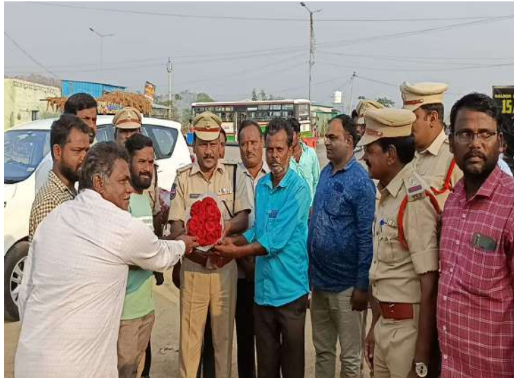
-ఒక్క సిసి కెమెరా వంద మంది పోలీసులతో సమానం