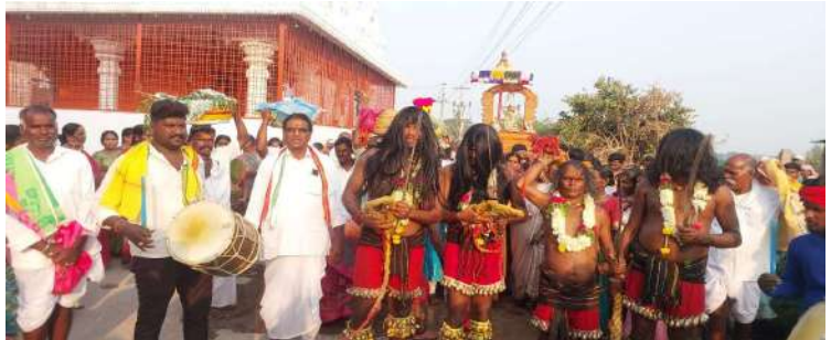
కొడిపల్లి ప్రజా జ్యోతి ఫిబ్రవరి 9