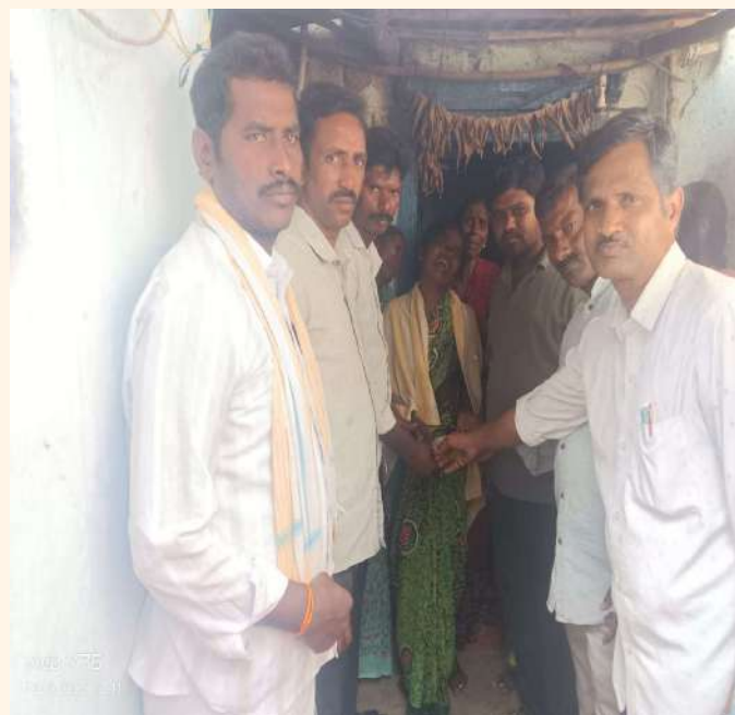
యాలో 9 ఫిబ్రవరి ప్రజా జ్యోతి