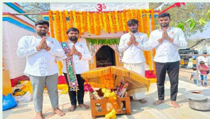
బహీరాబాద్ జనవరి 9 ప్రజా జ్యోతి