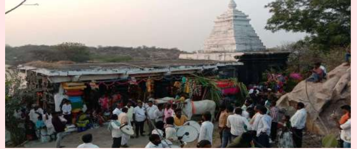
బేకూల్ (ప్రజాజ్యోతి ప్రతినిధి):