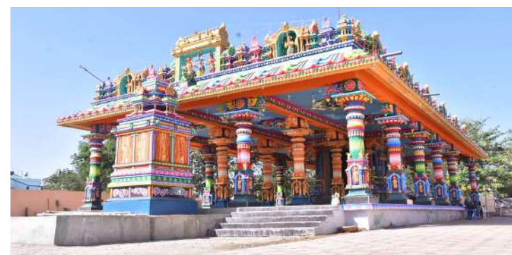
ప్రజా జ్యోతి ఆర్ సి, బీరూరు ఫిబ్రవరి 09 బీరూరు.