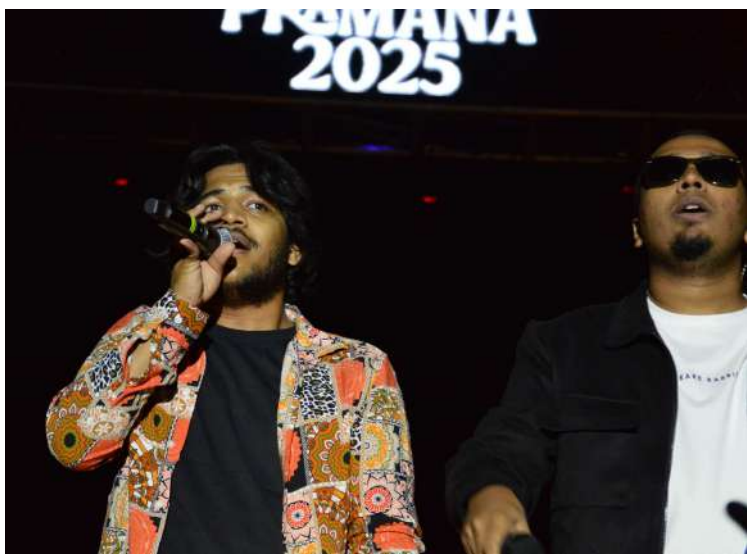
-అలరించిన సాంకేతిక -సాంస్కృతికోత్సవాలు - విద్యార్థులలో మిన్నంటిన కోలాహలం