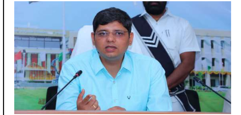
రాజంపేట (కామారెడ్డి) ఫిబ్రవరి 9 (ప్రజా జ్యోతి)

ప్రజా సమస్యల పరిష్కారం కోసం ప్రతి సోమవారం నిర్వహించే ప్రజావాణి కార్యక్రమం తాత్కాలికంగా వాయిదా వేయబడింది. శాసన మండలి ఎన్నికల ప్రవర్తనా నియమావళి అమలులో ఉన్న కారణంగా ఈ నిర్ణయం తీసుకున్నట్లు కామారెడ్డి జిల్లా కలెక్టర్ ఆశిష్ సాంగ్వాన్ ఒక ప్రకటనలో తెలిపారు. ఎన్నికల ప్రక్రియ పూర్తయిన తర్వాత ప్రజావాణి కార్యక్రమం యథావిధిగా కొనసాగుతుందని ఆయన స్పష్టం చేశారు. ప్రజలు ఈ విషయాన్ని గమనించి జిల్లా యంత్రాంగానికి సహకరించాలని కోరారు. ప్రజల విజ్ఞాపనలను స్వీకరించేందుకు కలెక్టరేట్ లో రూం నంబర్ 25 వద్ద హెల్ప్ డెస్క్ ఏర్పాటు చేసినట్లు కలెక్టర్ పేర్కొన్నారు. సంబంధిత దరఖాస్తులు హెల్ప్ డెస్క్ లో సమర్పించవచ్చని తెలిపారు.