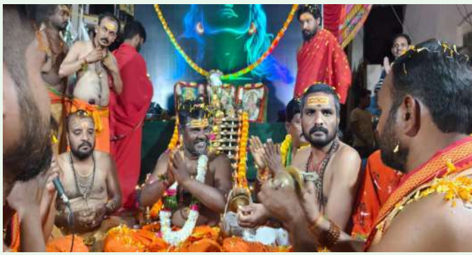
జహీరాబాద్, ఫిబ్రవరి 09 ( ప్రజా జ్యోతి న్యూస్ )