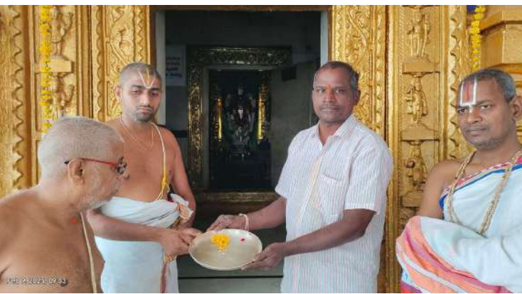
నాగర్ కర్నూల్, ఫిబ్రవరి 09 ప్రజా జ్యోతి