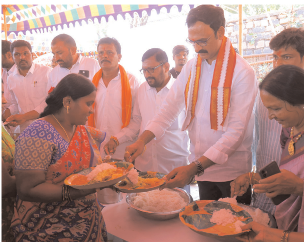
వేడుకలో హాజరైన ప్రముఖులు.