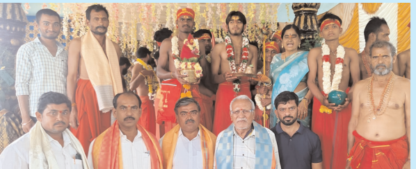
కారేపల్లి, ఫిబ్రవరి 11, ప్రజా జ్యోతి: