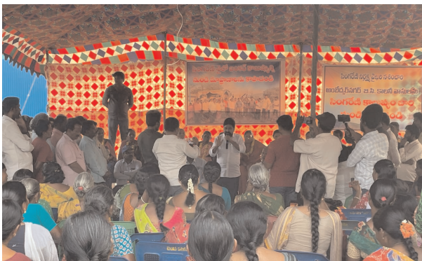
సత్తుపల్లి ఫిబ్రవరి 11 ప్రజా జ్యోతి.