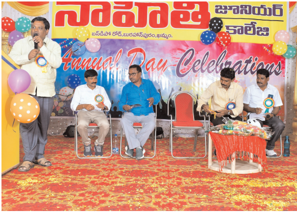
ఖమ్మం ప్రతినిధి ప్రజా జ్యోతి