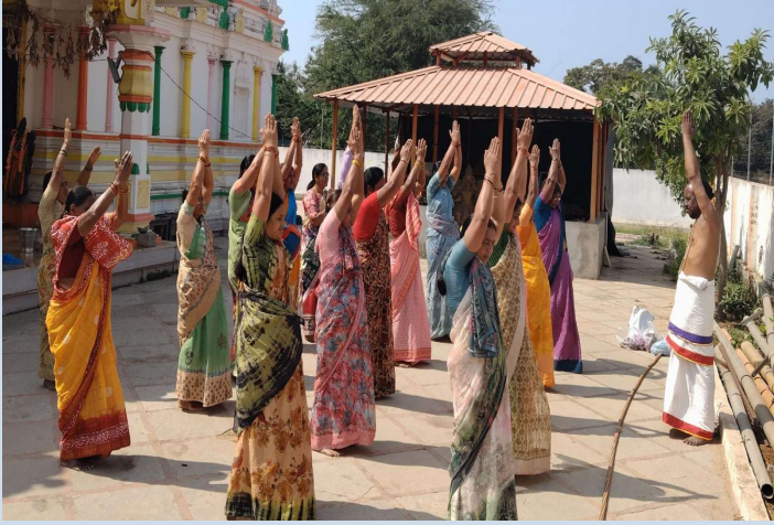
సత్తుపల్లి ఫిబ్రవరి 4 ప్రజా జ్యోతి.