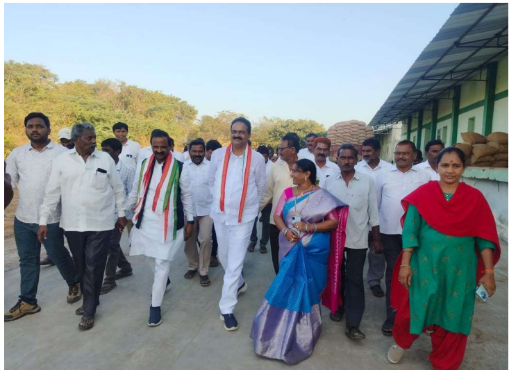
పాలేరు ఫిబ్రవరి 3 ప్రజా జ్యోతి