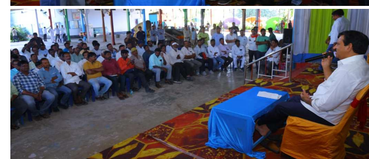
తెలిపారు. అలాగే మీడియా మిత్రుల విజ్ఞప్తి మేరకు కూసుమంచి కేంద్రంలో మీడియా హాజ్ కానీ ప్రెస్ క్లబ్ కానీ ఏర్పాటు చేయిస్తామని హామీ ఇచ్చారు. ఇవి కాకుండా ఇంకా ఏవైనా ఇబ్బందులు, సమస్యలు ఉంటే తన దృష్టికి తీసుకురావాలని జర్నలిస్టులకు సూచించారు. తన పరిధిలో ఉన్న సాధ్యమైన , న్యాయమైన కోరికలన్నీ పరిష్కరిస్తామని మంత్రి పొంగులేటి వారికి హామీ ఇచ్చారు. ఈ కార్యక్రమంలో నాలుగు మండలాల జర్నలిస్టులు పాల్గొన్నారు.