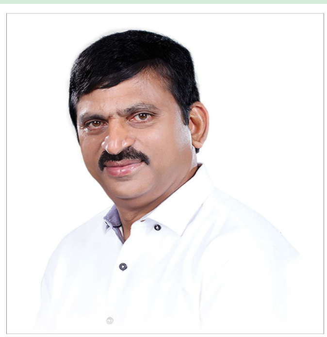
ఖమ్మం ప్రతినిధి ప్రజా జ్యోతి

-పైనల్లో త్రిష ప్రదర్శన ఉమ్మడి ఖమ్మం జిల్లాకు గర్వకారణమని ప్రశంస