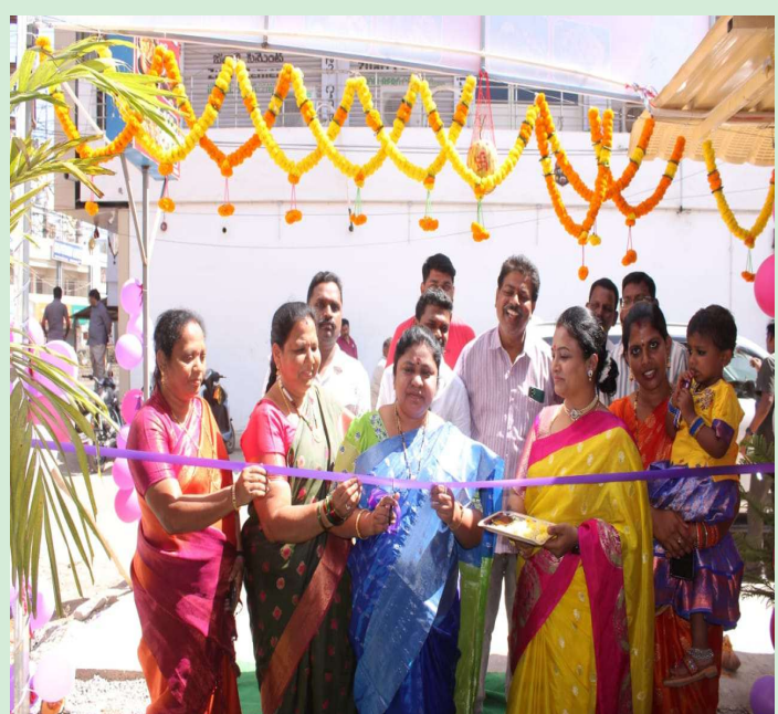
సత్తుపల్లి ఫిబ్రవరి 02 ప్రజా జ్యోతి