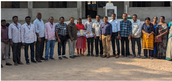
కోదాడ టౌన్, ఫిబ్రవరి 5 (ప్రజా జ్యోతి): సూర్యాపేట జిల్లా స్థాయి కేంద్రం లో

- జిల్లా స్థాయి ఫిజికల్ సైన్స్ టాలెంట్ టెస్ట్ పోటీలో కోదాడ విద్యార్థినికీ తృతీయ స్థానం