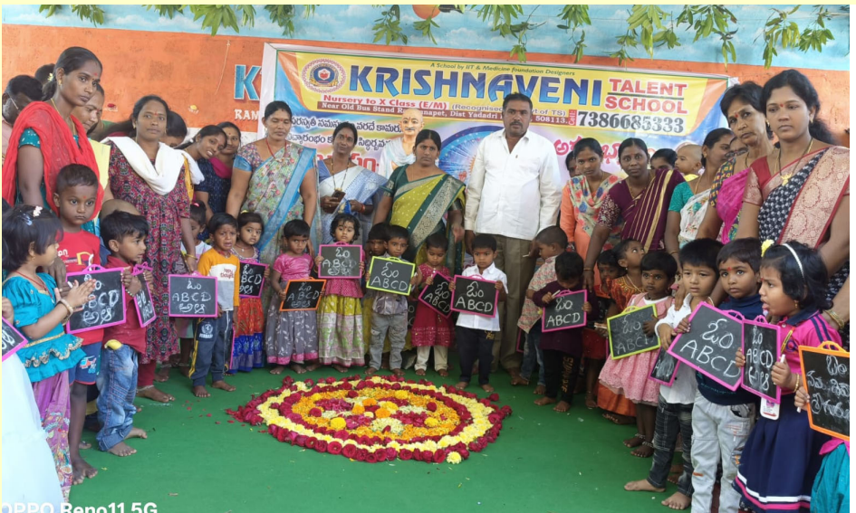
OPO Reno11 5G