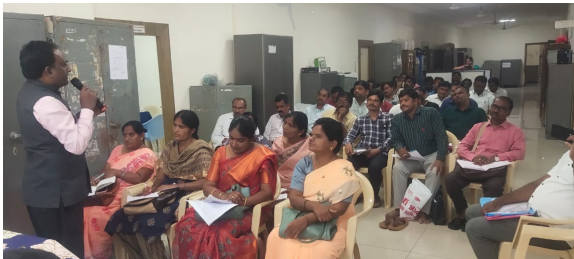
నల్గొండ, ఫిబ్రవరి 3 (ప్రజాజ్యోతి) నల్లగొండ జిల్లా కేంద్రంలో జిల్లా గిరిజన సంక్షేమ శాఖ అధ్యక్షుల కేంద్ర ప్రభుత్వం గిరిజన విద్యార్థుల సంక్షేమం కోసం