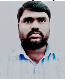
వ్యాసం రచయిత: గట్టిగుండ్ల, రాము జర్నలిస్ట్

అంటే ప్రశ్న డప్పు అంటే హక్కుల పోరు. డప్పు అంటే మండే నిప్పుల కొలిమి. డప్పు అంటే తిరుగుబాటు. డప్పు అంటే బలహీనుల బలము. డప్పు అంటే ఉపసేన. డప్పు అంటే పసి పిల్లల చిరు నవ్వు డప్పు అంటే మనసును తాకే మధుర నాదం, ఆ డప్పు రూపం సాధారణంగా తలభాగం 32 సెంటీ మీటర్ల నుంచి, 23 సెంటీ మీటర్లు ఉంటుంది. డప్పు దరువు అనేది ప్రాచీనమైన సంగీత కళ. గ్రామాలలో డప్పు వాయిద్యానికి అధిక ప్రాధాన్యం ఇస్తారు. గతంలో పెళ్ళిళ్ళ సందర్భంలో ఎన్ని ఎక్కువ డప్పులు ఉపయోగిస్తే ఆ పెళ్ళి ఊరేగింపు గురించి అంత గొప్పగా చెప్పుకునేవారు. అప్పట్లో ప్రతి కార్యక్రమాని కి డప్పు ఉండాలి. ఈ నాటికీ చాలా పల్లెల్లో డప్పు ద్వారానే చాటింపు వేస్తూ ఉంటారు. సమాచారాన్ని చేరవేయడంలో డప్పు ప్రత్యేకత వేరు. ఏ మీడియా లేని రోజుల్లో డప్పునే మొదటి మీడియా కానీ ఇప్పుడు కనుమరుగవుతున్న ప్రాచీణ సంగీత కళల్లో డప్పు మొదటిది. ప్రతి మాటకు ప్రతి పాటకు ప్రతి ప్రశ్నకు ప్రతి బదులుకు మొదటి చివర నిలిచేది డప్పు. ఉప్పులేని కూర ఎలా ఉంటుందో. డప్పు లేని కార్యం, కార్యక్రమం కూడా అలానే ఉంటుంది. కాబట్టి పాటకు ప్రాణం పోసేది. ఆహ్లాదకరమైన. ఆలోచన పుట్టించేది. ఆనందాన్ని ఇచ్చేది. అగ్నిరాజేసేది, ఉగ్గ పాలు తాగే పసిపిల్లలకు నిద్రపుచ్చేది కూడా డప్పునే. అందుకే డప్పు సబ్బండ వర్గాల గొంతుకైంది. డప్పు అలాంటి ప్రత్యేక ప్రపంచ ప్రధమ సంగీత నాదాన్ని సృష్టించిన ఆదిమ శిల్పి మాదిగకు వందనం. కనకన ద్రోగ నిరసనల నిప్పుల నాదమైన డప్పు కు వందనం. ఆ డప్పు ను డప్పు కలలను భావితరాలకు అందించేందుకు కృషి చేస్తున్న డప్పు కళాకారులకు వందనం. డప్పుకు వందనం.