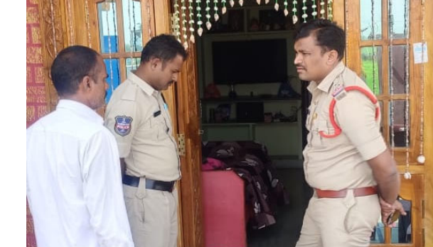
గరిడేపల్లి, ఫిబ్రవరి 21 (ప్రజా జ్యోతి): దొంగల హాల్ చల్ ఒకే రోజు రెండు ఊర్లలో దొంగతనం చేసిన సంఘటన శుక్రవారం సూర్యాపేట జిల్లా గరిడేపల్లి