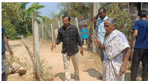
కోదాడ టౌన్, ఫిబ్రవరి 18 (ప్రజా జ్యోతి): ఎవరన్నా స్థలాలు ఎక్కరాలు చెరువులు కుంటలు ఖబ్బా చేస్తూ ఉంటారు. కానీ ఓ గ్రామంలో వీధులను కూడా వదలకుండా ఖబ్బా చేయడంతో వీధిలో ఉన్న కాలనీవాసులు ఆందోళన వ్యక్తం చేసిన సంఘటన మండల పరిధిలోని గణపవరం గ్రామంలో సోమవారం చోటుచేసుకుంది. బాధితులు స్థానికులు మాట్లాడుతూ కోదాడ మండల పరిధిలోని