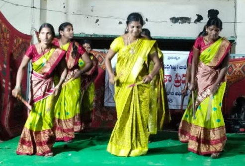
అంతరించిపోతున్న పల్లె పాటలు, జానపద గేయాలు, సంస్కృతి సంప్రదాయాలపై పెద్దగట్టు లింగమంతుల స్వామి వారి పై పాడిన పాటలు అలాగే పురాతన దేవాలయాలపై, జాతర చరిత్ర పై చెప్పిన కథలు వీక్షకులు ఆసక్తిగా తిలకిస్తున్నారు.