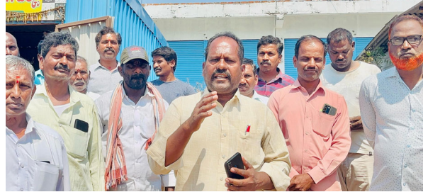
ఆలేరు, ఫిబ్రవరి 18 (ప్రజాజ్యోతి): ఆలేరు పట్టణంలోని ప్రభుత్వ ఆసుపత్రి ఎదురుగా ఉన్న వీధి వ్యాపారులను మంత్రి కోమటిరెడ్డి వెంకటరెడ్డి పేరు చెప్పి వారిని బెదిరించడం మానుకోవాలని సిపిఎం పట్టణ కార్యదర్శి ఎం ఎ.ఎగ్జాల్ట్ అన్నారు. ఆలేరు మార్కెట్ కమిటీ కార్యాలయం ఒకరి గోడ నానకొని కొన్నేళ్లుగా ఉపాధి పనులు చేసుకుంటున్న చిరు వ్యాపారులను, ఇటీవల మార్కెట్ కమిటీ నిర్మించిన కమర్షియల్ దుకాణాలను నిర్మించింది. తమ వ్యాపారాలకు అడ్డుగా ఉన్న చిరు వ్యాపారుల దుకాణ సముదాయాలను తొలగించేందుకు మంత్రి కోమటిరెడ్డి వెంకటరెడ్డి పేరు చెప్పి బెదిరిస్తున్నారని, తమకు ఉపాధి కరువై బ్రతుకు సుష్టంగా ఉందని చిరు వ్యాపారులు ఎంఎ ఇక్కాల్ కు తమ గోడును వినిపించారు. ఈ సందర్భంగా ఇక్కాల్ మాట్లాడుతూ