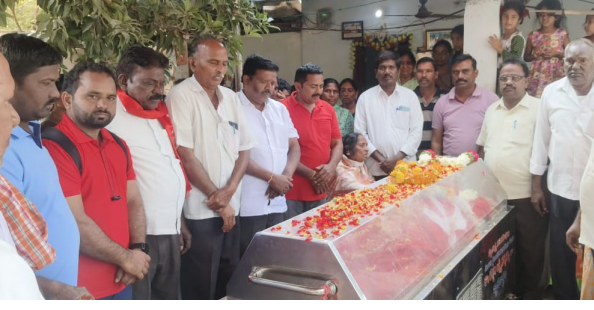
పెన్ హహాడ్ ఫిబ్రవరి 12 (ప్రజా జ్యోతి): మండల పరిధిలోని చెట్ల ముకుందాపురం గ్రామానికి చెందిన సిపిఎం మాజీ ఎంపీటీసీ, పి పి ఎస్ డైరెక్టర్ గా పనిచేసిన