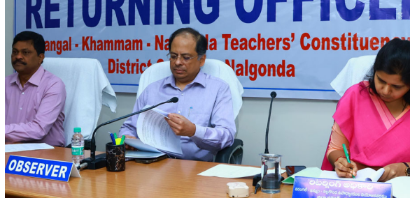
నల్లగొండ, ప్రజాజ్యోతి ప్రతినిధి: వరంగల్, ఖమ్మం, నల్లగొండ ఉపాధ్యాయ ఎమ్మెల్సీ ఎన్నికల నామినేషన్ల పరిశీలన మంగళవారం నల్లగొండ జిల్లా కలెక్టర్ కార్యాలయంలోని